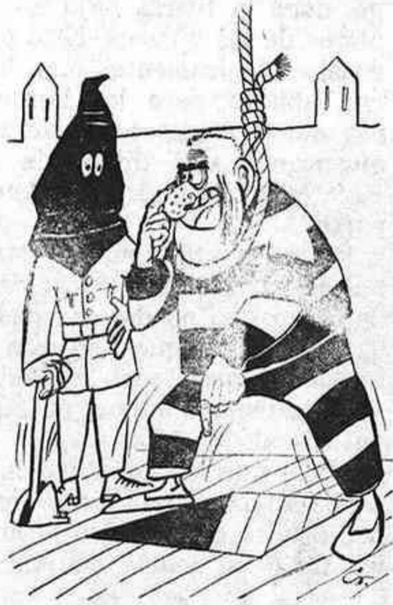
Que no cuela, hombre; que no cuela; que esto no es la apertura.