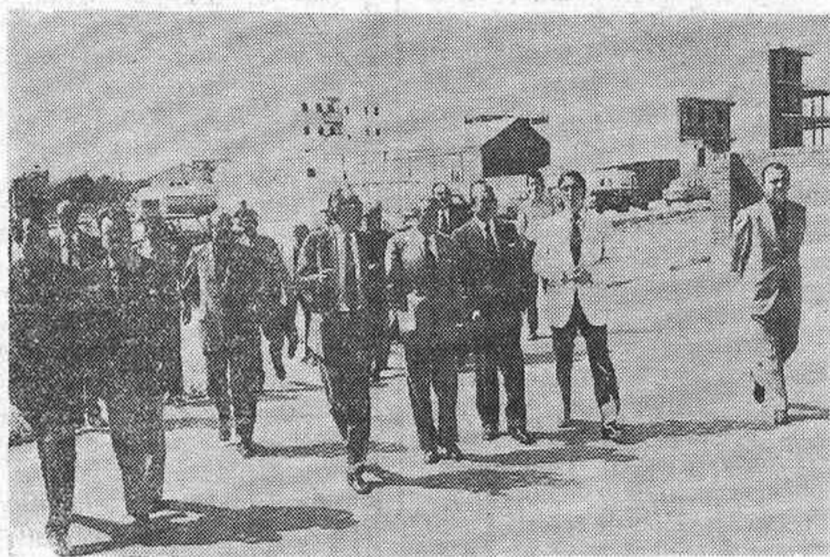
La llegada al grupo escolar inaugurado en Azuqueca de Henares.

En la mañana del pasado sábado tuvieron lugar diversas