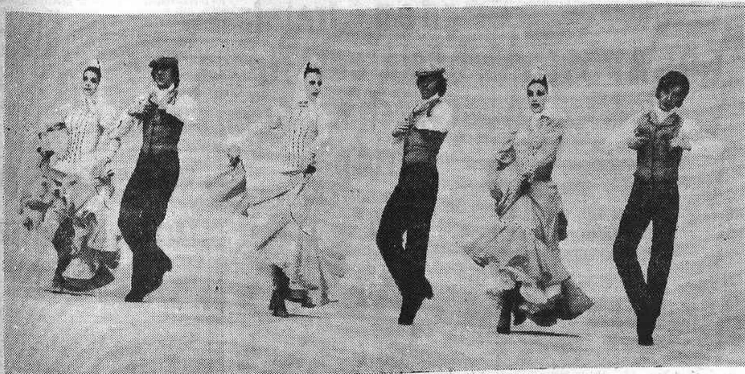
Ballet Festivales de España, que actuará mañana.

luta y rigurosamente asequibles. No nos queda, después del auténtico regalo de espectáculo de anoche, que agradecer al Ministerio de Información y Turismo y al Ayuntamiento de nuestra capital su generosidad y su esfuerzo por acercar a Guadalajara una embajada cultural de la insuperable calidad de este Festival, que ha arrancado con magnífico signo.