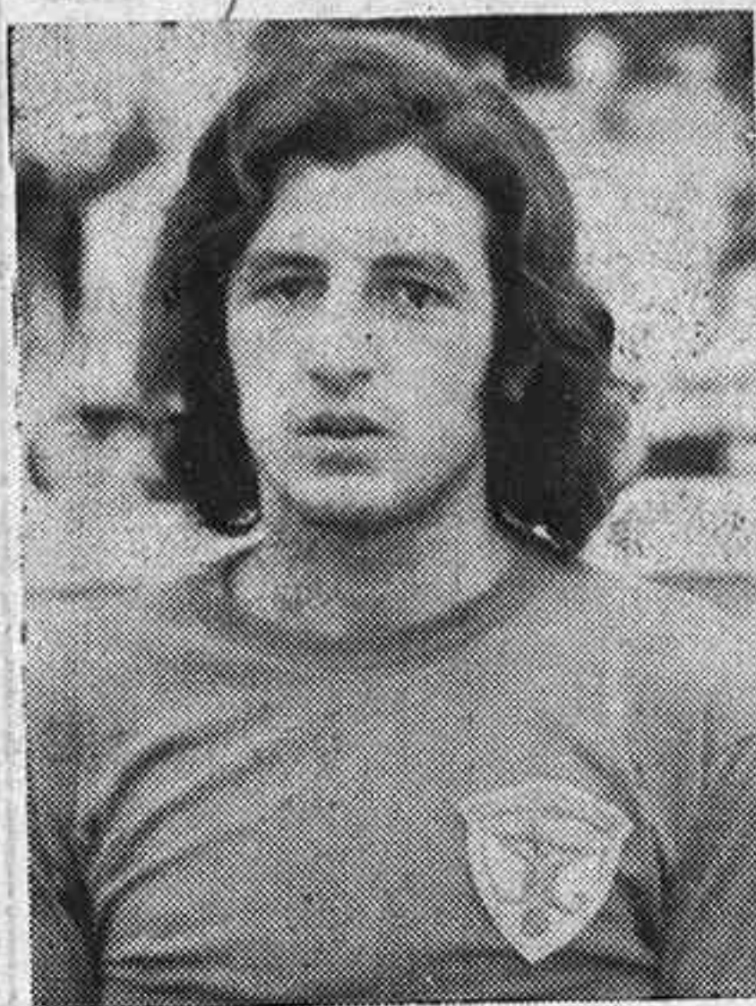
COLOSCOU. A pesar de la lesión que arrastra desde hace algunas jornadas, sigue siendo uno de los hombres más efectivos del Deportivo.

El Deportivo no ha jugado bien, y ello nos preocupa porque no ha sido éste un partido aciago, sino que su actuación ha sido similar a las últimas realizadas en el «Pedro Escartín», en las que el equipo parece haber entrado en un pequeño bache, en el que ha quedado disminuida su capacidad realizadora ante las puertas contrarias. Mielgo ha planteado el partido con cautela, pues conocía la valía del contrario, pero el Carabanchel ha tenido una baza importante que ha influido decisivamente en su victoria, y es que Herrero, el goleador y hábil delantero, ha (pasa a la pág. 6.)