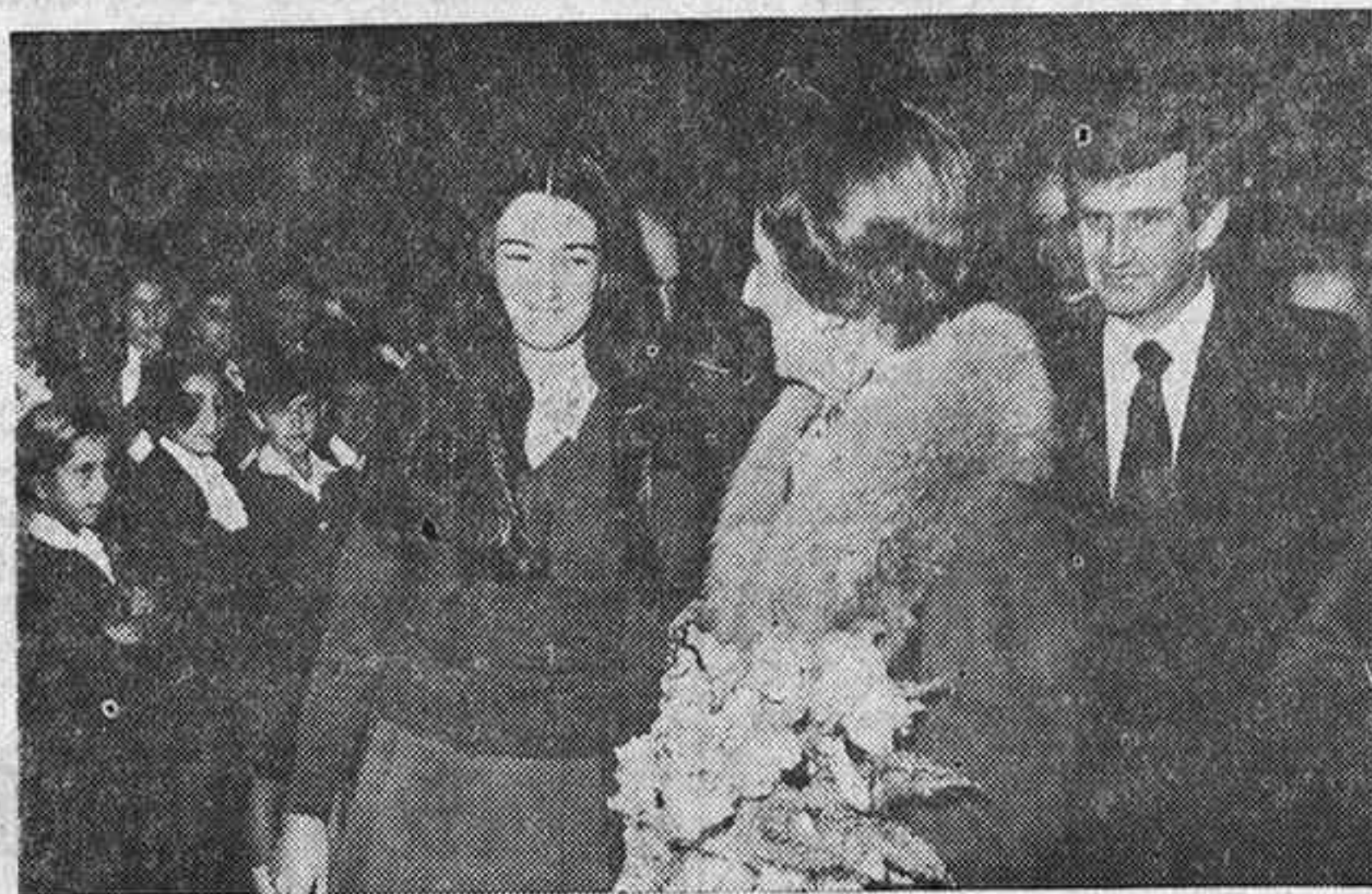
La visita de la Excm. Sra. D.ª Carmen Polo de Franco, marcó, sin duda alguna, el momento estelar en orden a visitas de personalidades.

El ministro de Relaciones Sindicales, señor García Ramal, el día 17 de enero, con un programa de encuentros y reuniones con distintos órganos de la Organización Sindical de la mayor importancia.