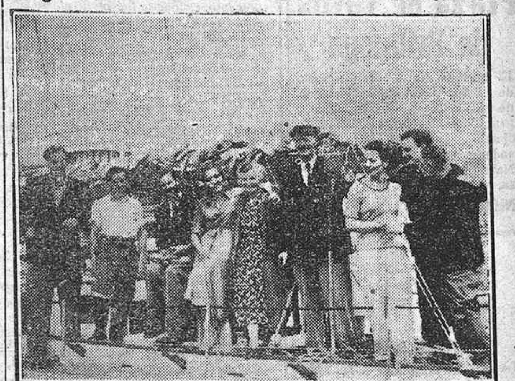
Sobre cubierta, los tripulantes del yate "Erivaltea", que se clasificó en segundo lugar