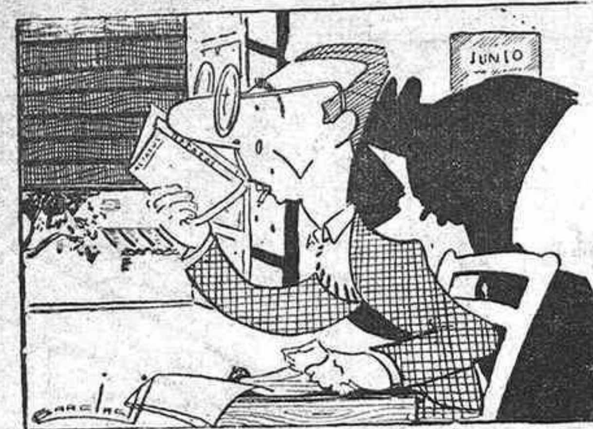
A "Los del 90" les va a sonar mal.

Jacinto prepara para octubre la partitura de "Los del 0,9".