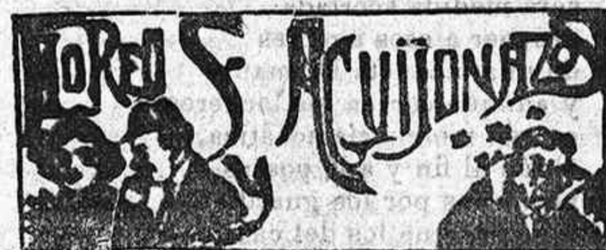
Después de lo bailado