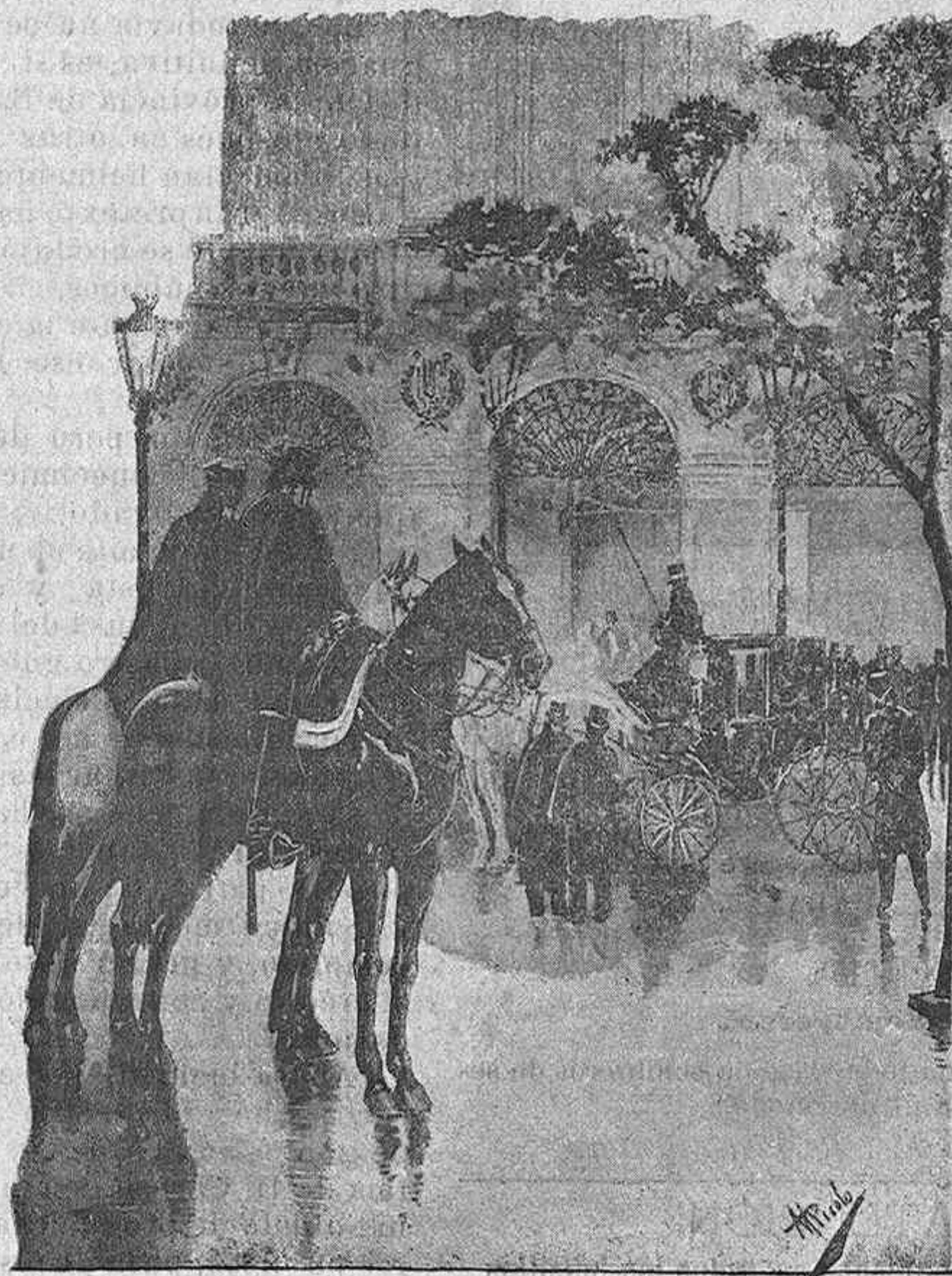
SALIDA DEL TEATRO REAL