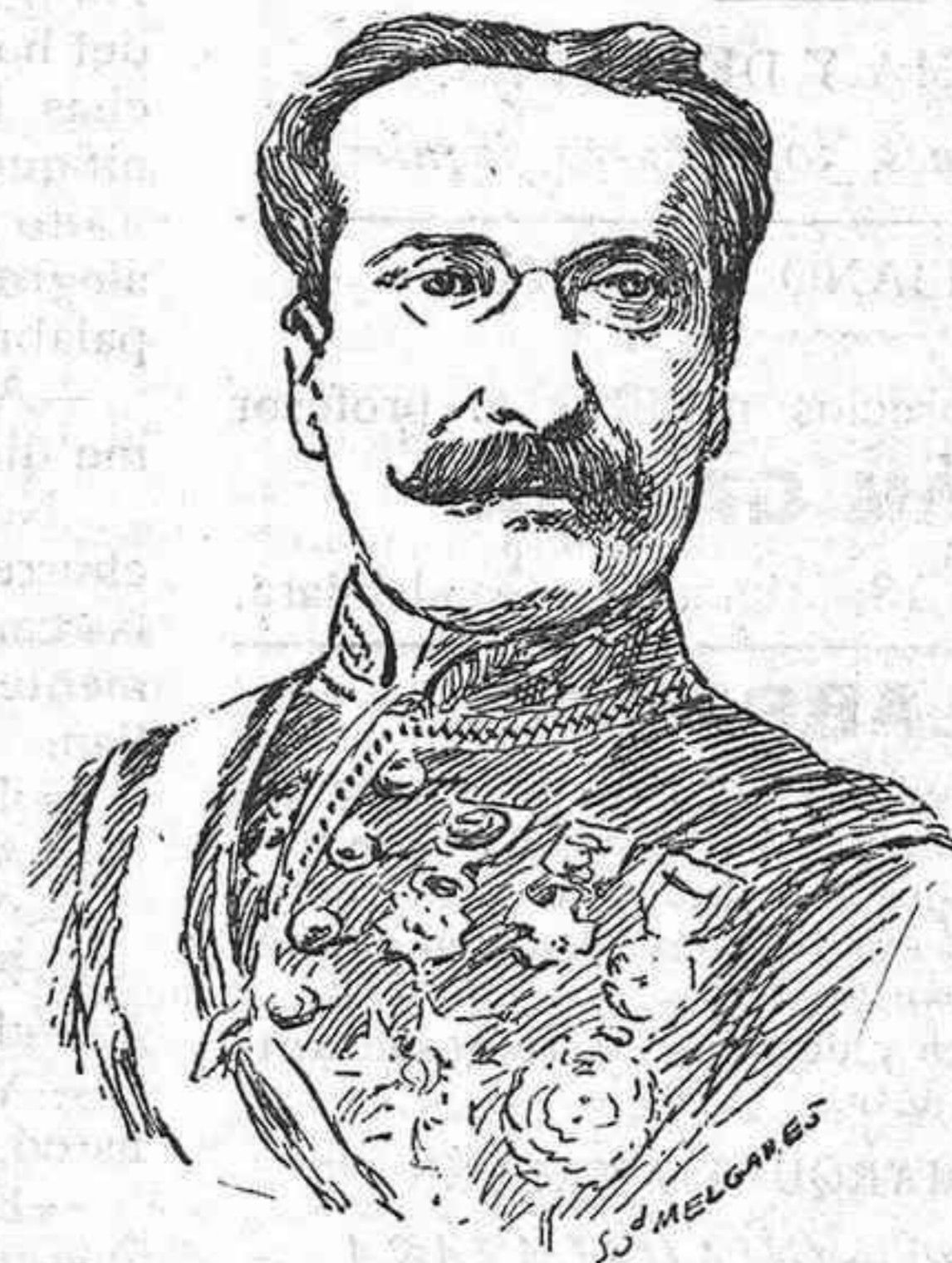
D. Emilio Ojeda

Nuevo embajador de España en el Vaticano