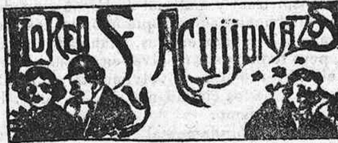
¡Agarraissus a la pader!

Se corta, prepara y confecciona toda clase de prendas de vestir, para señora y niño, a precios económicos