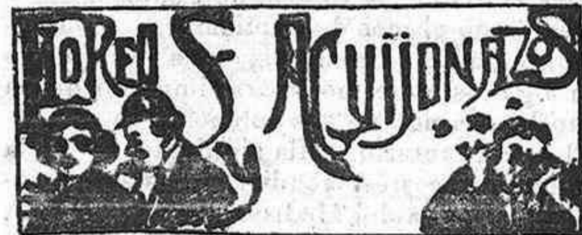
La juerga de costumbre

Reciban los nuevos esposos nuestra más cordial enhorabuena.