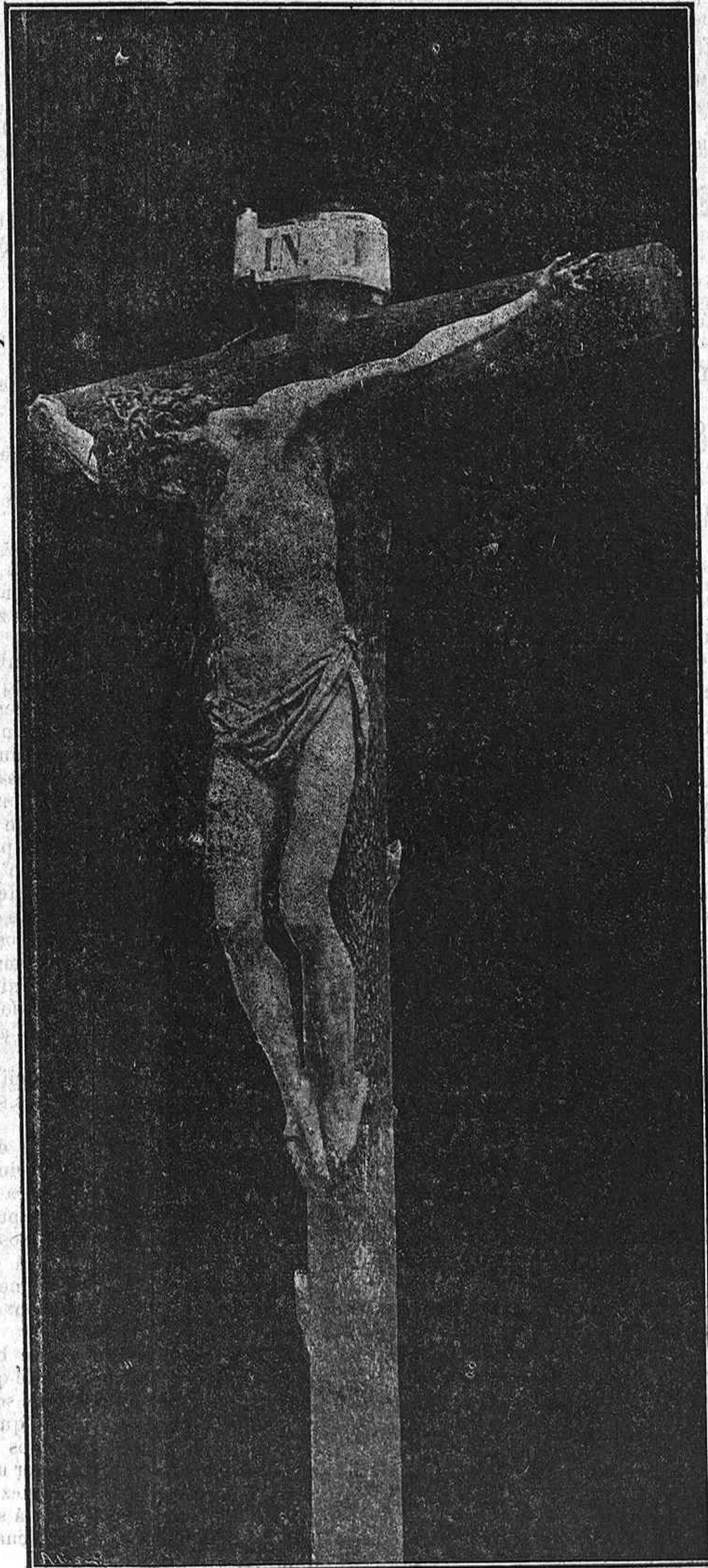
El Santo Cristo (Catedral de Pamplona).—Escultura de Miguel Ancheta.