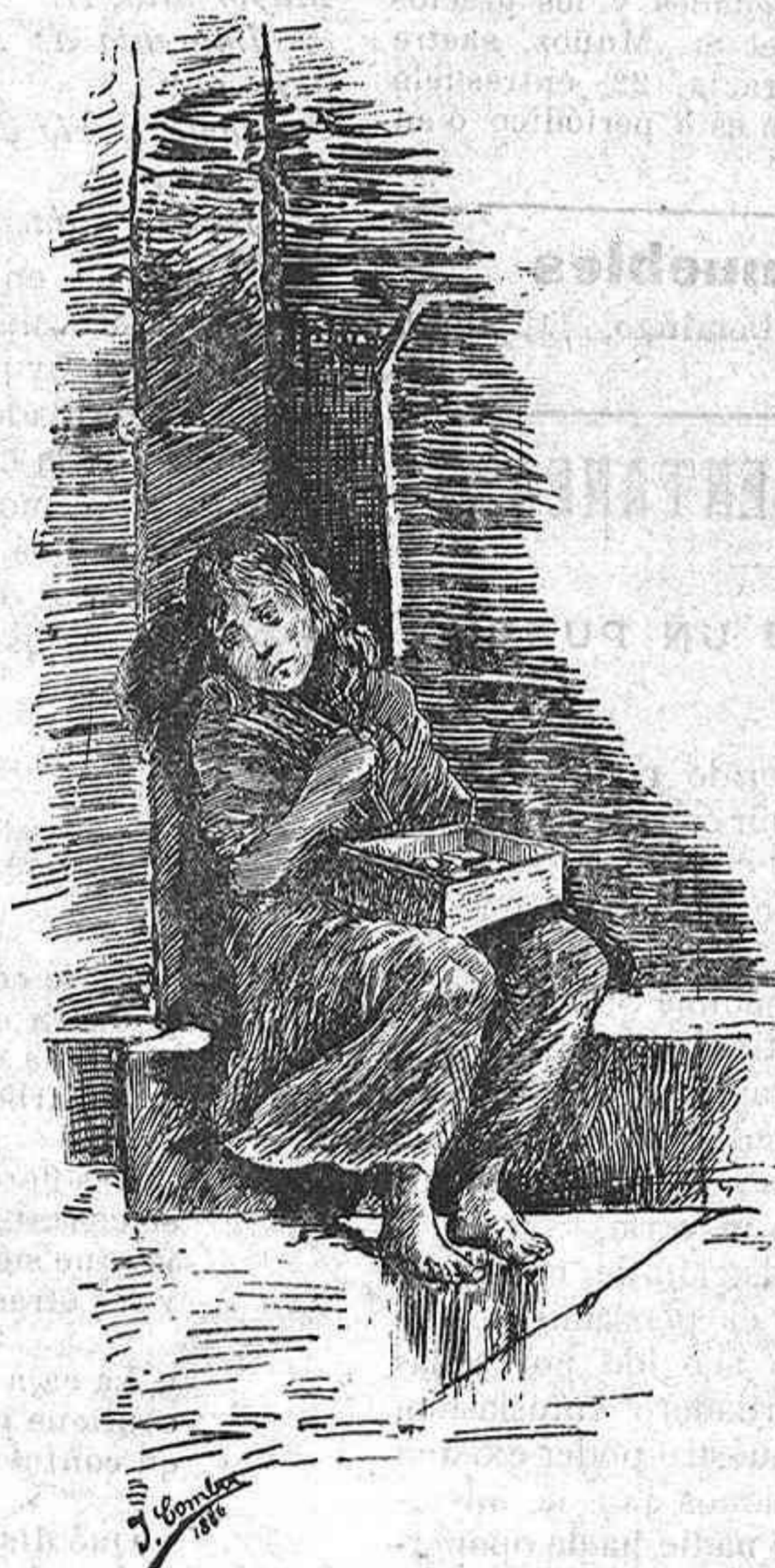
DIBUJO DE COMBA