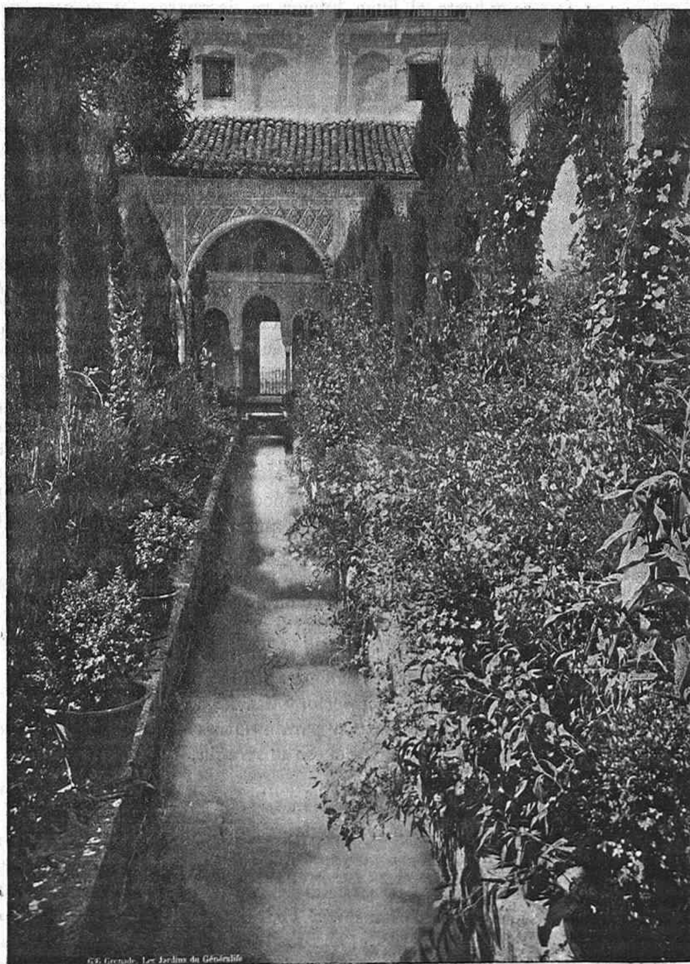
PATIO DEL GENERALIFE