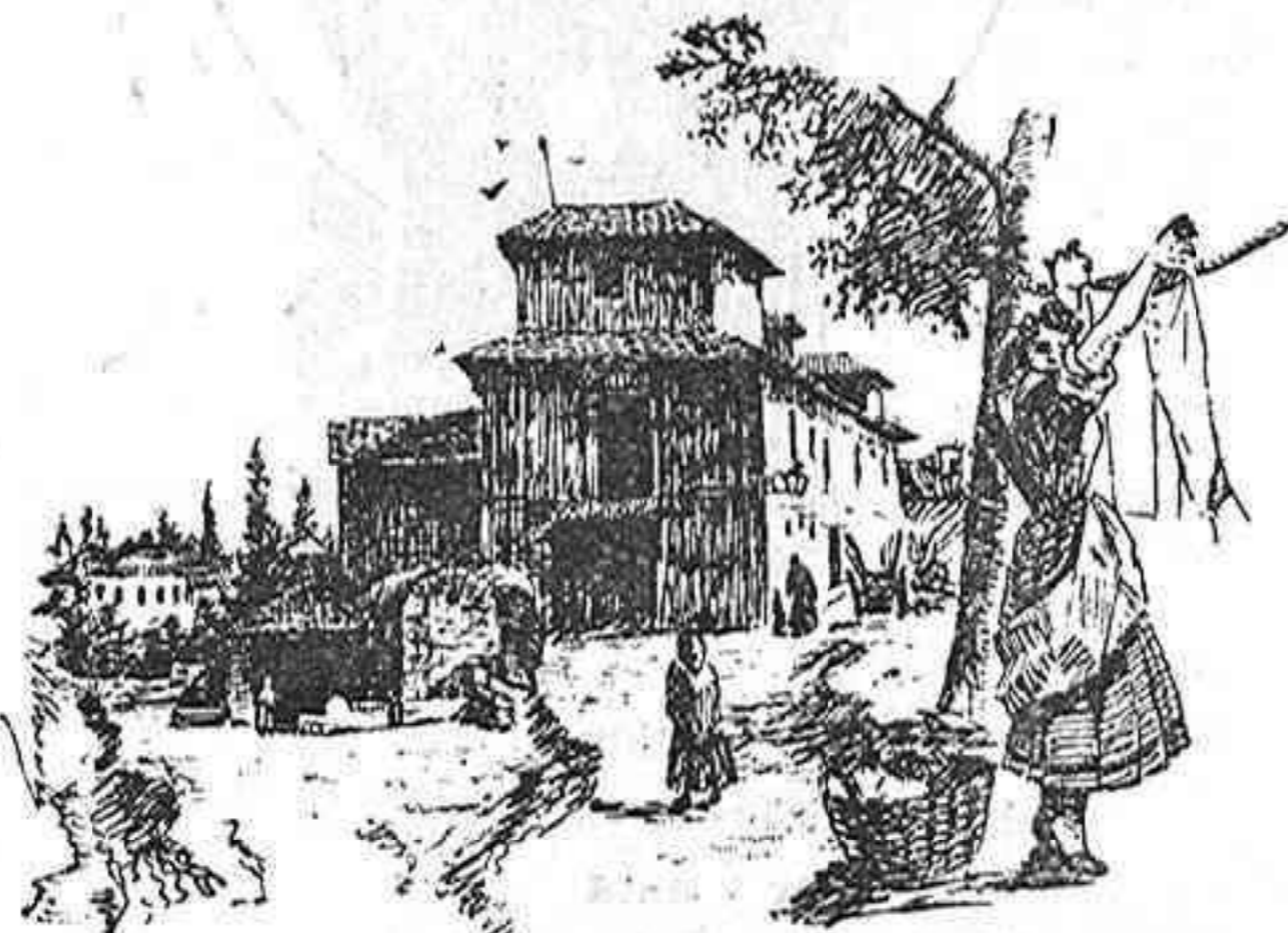
LAVADERO DE SANTA ANA.