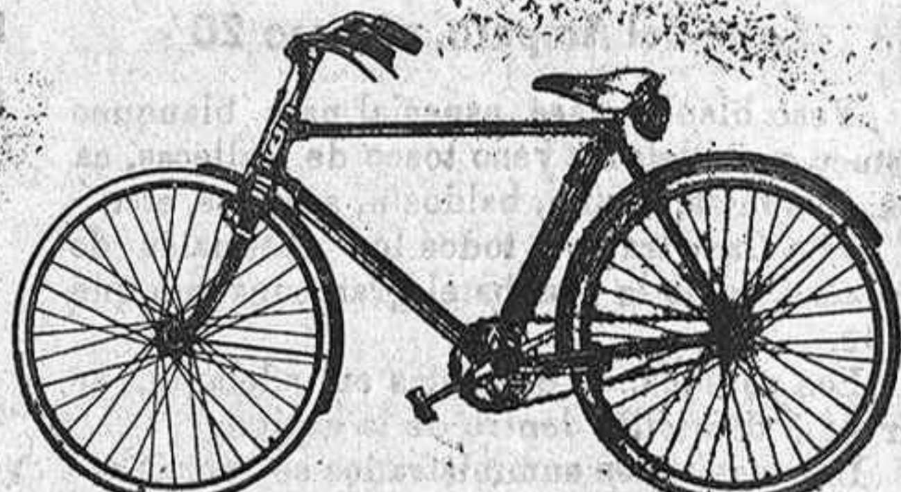
MODELO N° 10 PASEO GRAN VÍO.

Carreras: Veteranos de la U.V. (Tetuan); Real Madrid (190-100); Thomann U.V.E. 100 K U.V.E. (160 K); Copa Antón; Club Español; Inauguración U.V.E. (100 Km).