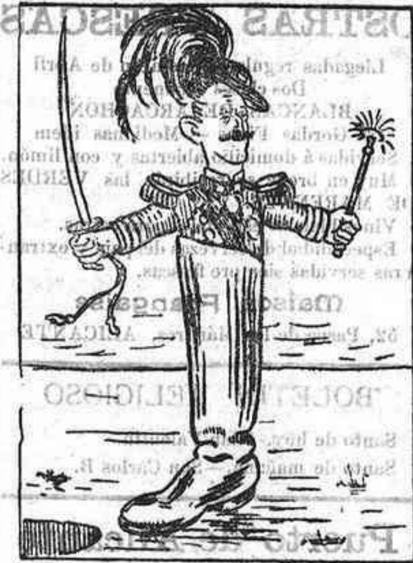
El gran pachá de Tripolitana VICTOR MANUEL III