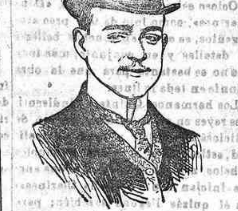
Su Majestad el Rey de Portugal D. Manuel II