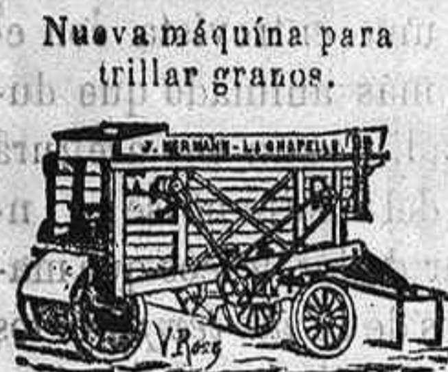
Nueva máquina para trillar granos.

Nuevos molinos de harina sobre zócalo Boffeol de hierro.