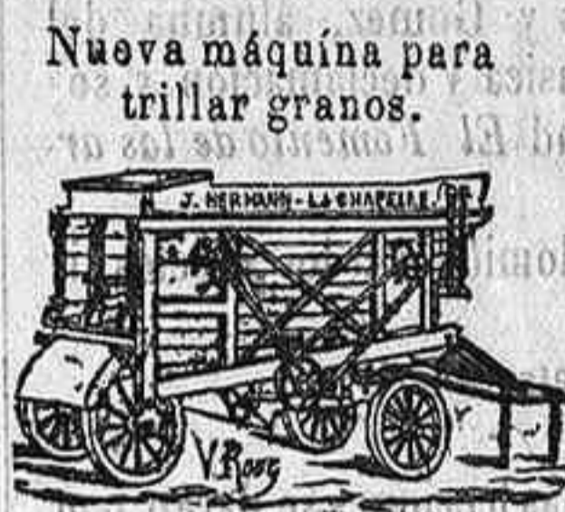
Nueva máquina para trillar granos.

Nuevos molinos de harina sobre zócalo Boffeoi de hierro.