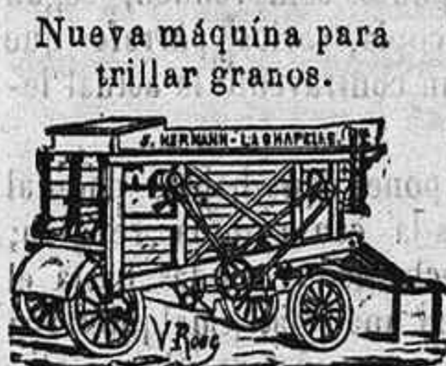
Nueva máquina para trillar granos.

Nuevos molinos de harina sobre zócalo Boffeoi de hierro.