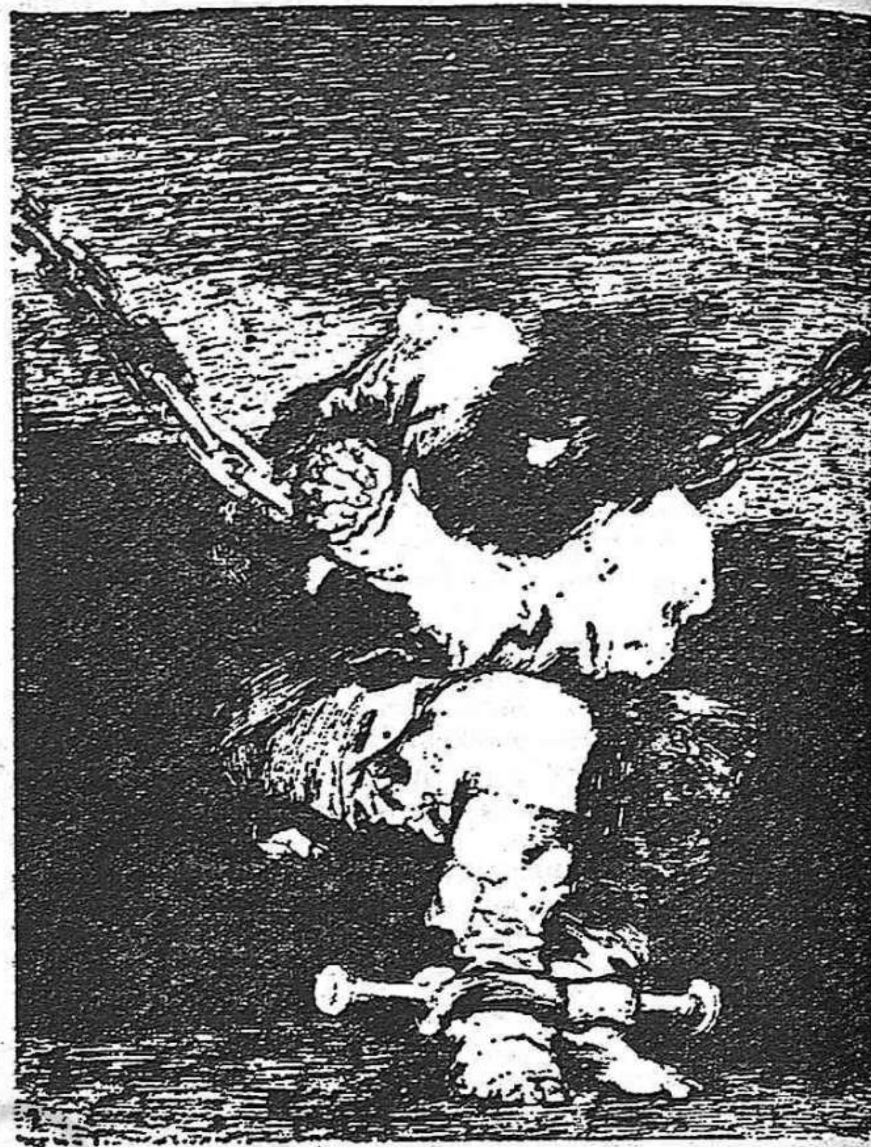
Goya: «EL PRISIONERO»