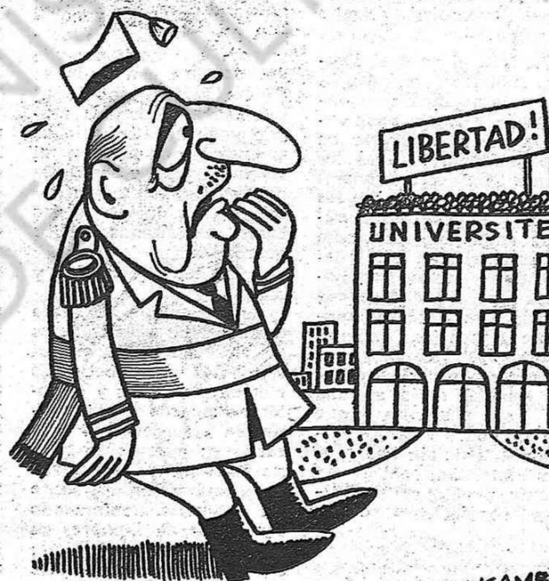
— ¿Gozaré yo de todas mis facultades?

Patrocinada por el « Comité Sindical Español », de Baden (Suiza) ha sido inaugurada en esta ciudad una exposición de arte, el 27 de marzo, en los salones de Martinsberg.