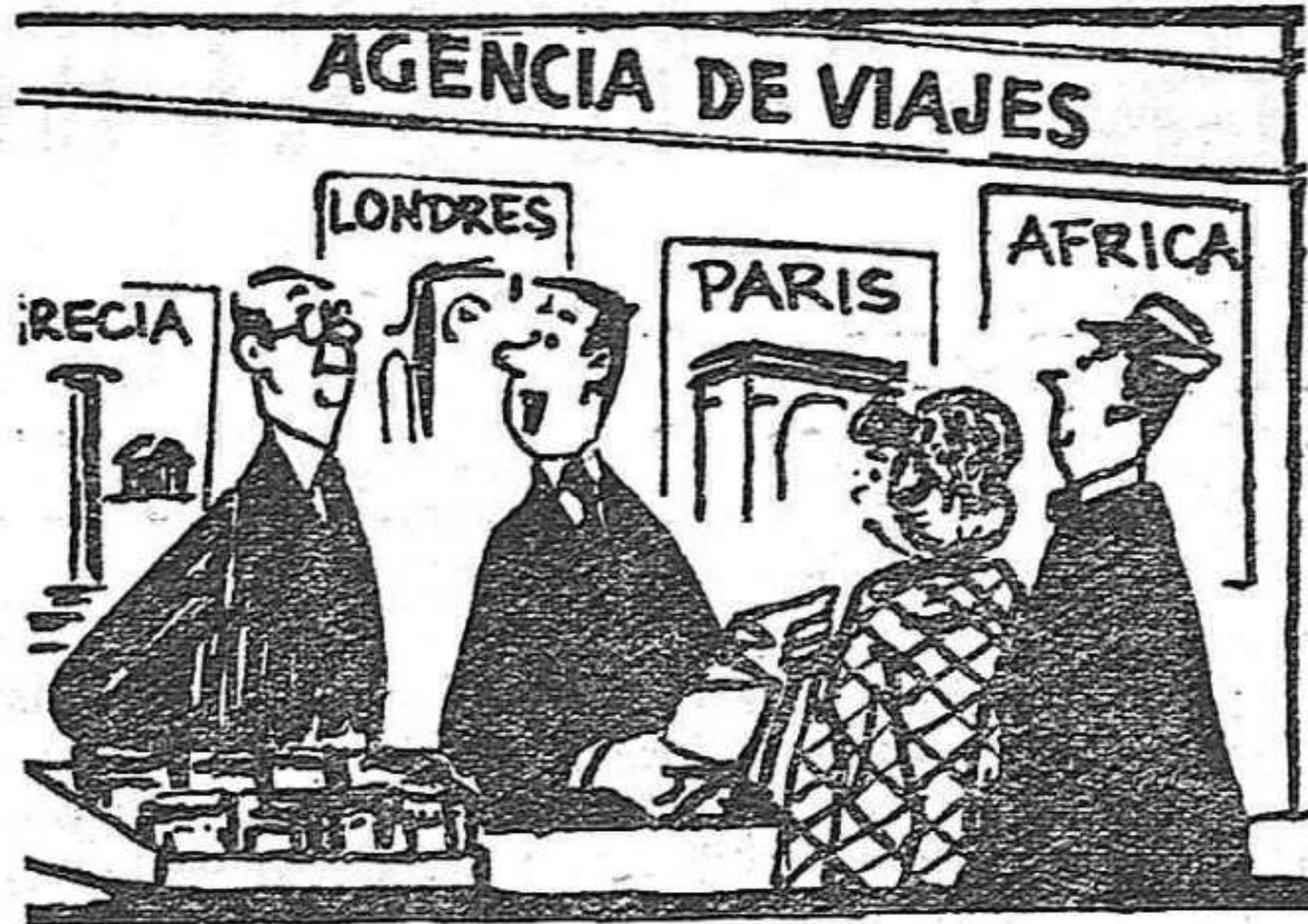
— Este señor quiere lo imposible: ir a un país donde no apedreen la Embajada norteamericana.

En 1962 el general Taylor declaraba en Saigón que « la pacificación completa de Vietnam sería cosa hecha a la vuelta de año y medio ». Pero los planes de este general « pacificador » que con los dólares y el poderío militar americano pretendía meter en cintura a un pueblo, ducho ya en una heroica guerra de independencia contra el colonialismo francés, se vinieron por tierra. Hace unos días un corresponsal de un diario español decía en una de sus crónicas que « ...el poderío de los dólares sostiene allí una guerra intestina entre un mismo pueblo cuyas intimas convicciones distan