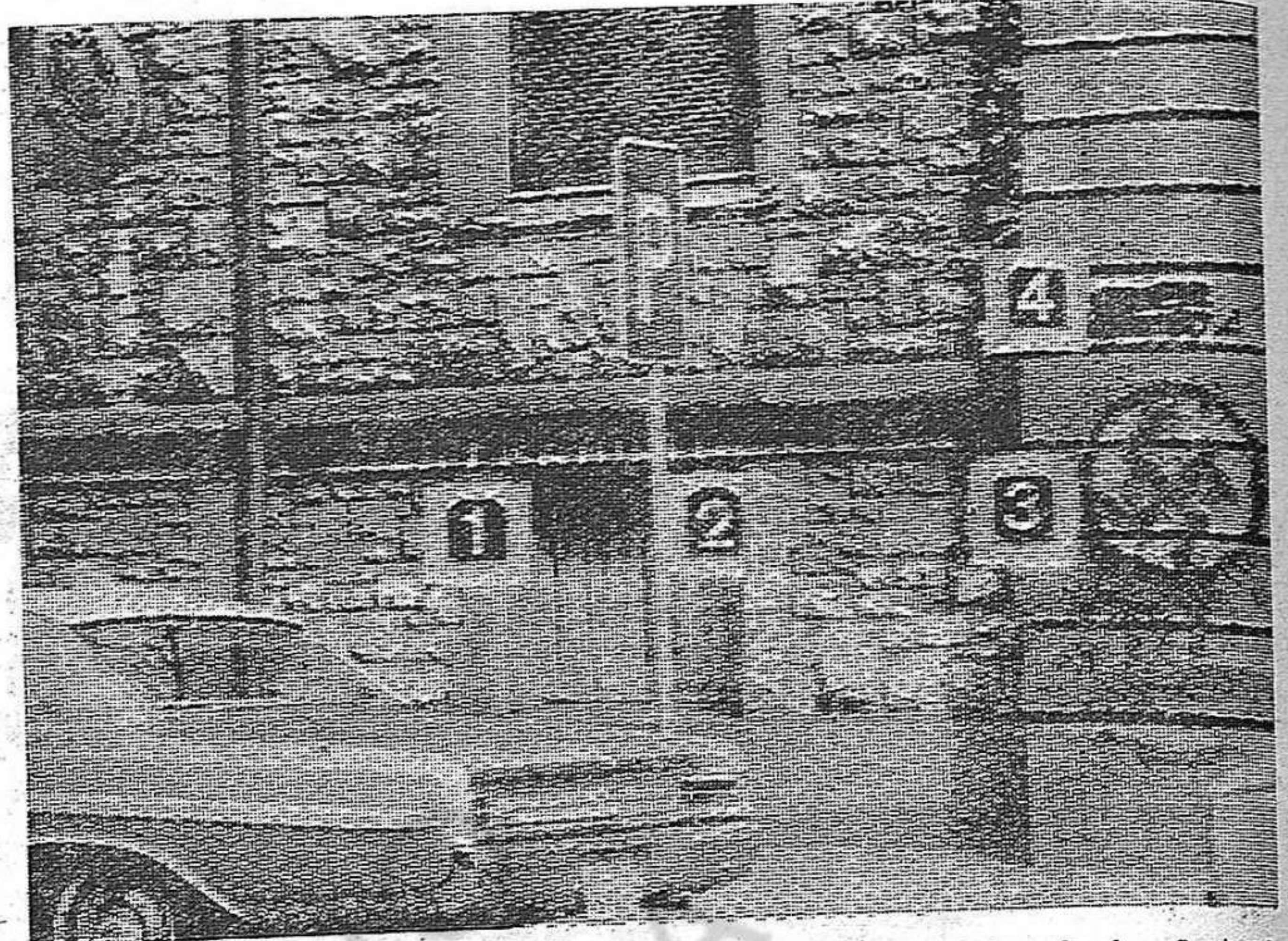
Fotografía publicada por la prensa suiza de Zurich. 1. Libertad (en alemán); 2. Asesinos; 3. La cruz gamada; 4. El letterero del Consulado borrado con pintura negra. Tales fueron las inscripciones en la fachada del Consulado franquista.

En la tarde del mismo día, a las 7, tuvo lugar una manifestación conjunta de estudiantes belgas y obreros españoles, que recorrió las calles céntricas de Bruselas testimoniando su solidaridad con los estudiantes, con el pueblo español en lucha y su condena de los regímenes de Franco y Salazar.