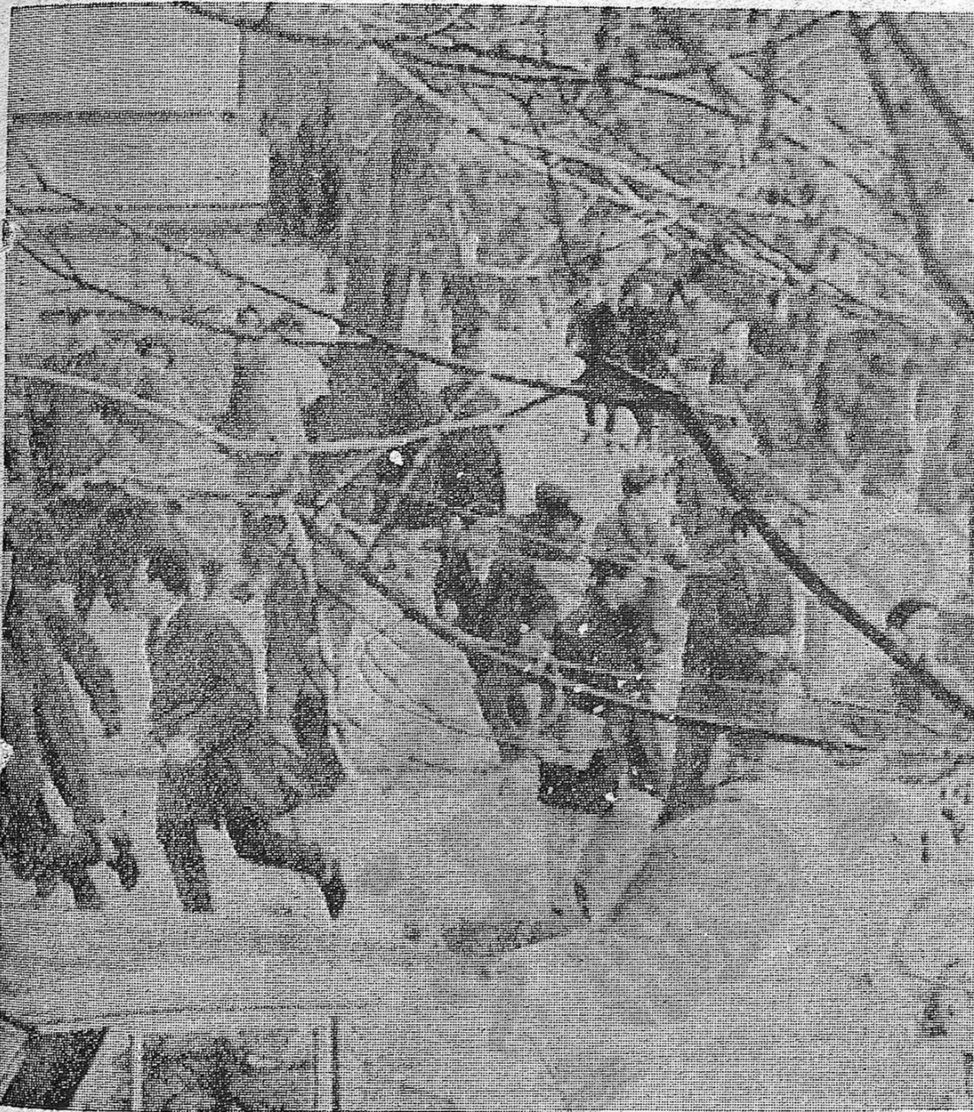
La manifestación estudiantil del 3 de marzo en Madrid. Reproducimos este cliché, publicado en la prensa francesa, por su valor de documento rarísimo. En efecto, la policía franquista se ataca con particular saña contra los fotógrafos de prensa que intentan tomar vistas de las manifestaciones que se desarrollan en todo el país

(VER NUESTRAS INFORMACIONES EN PAGINA 5-)