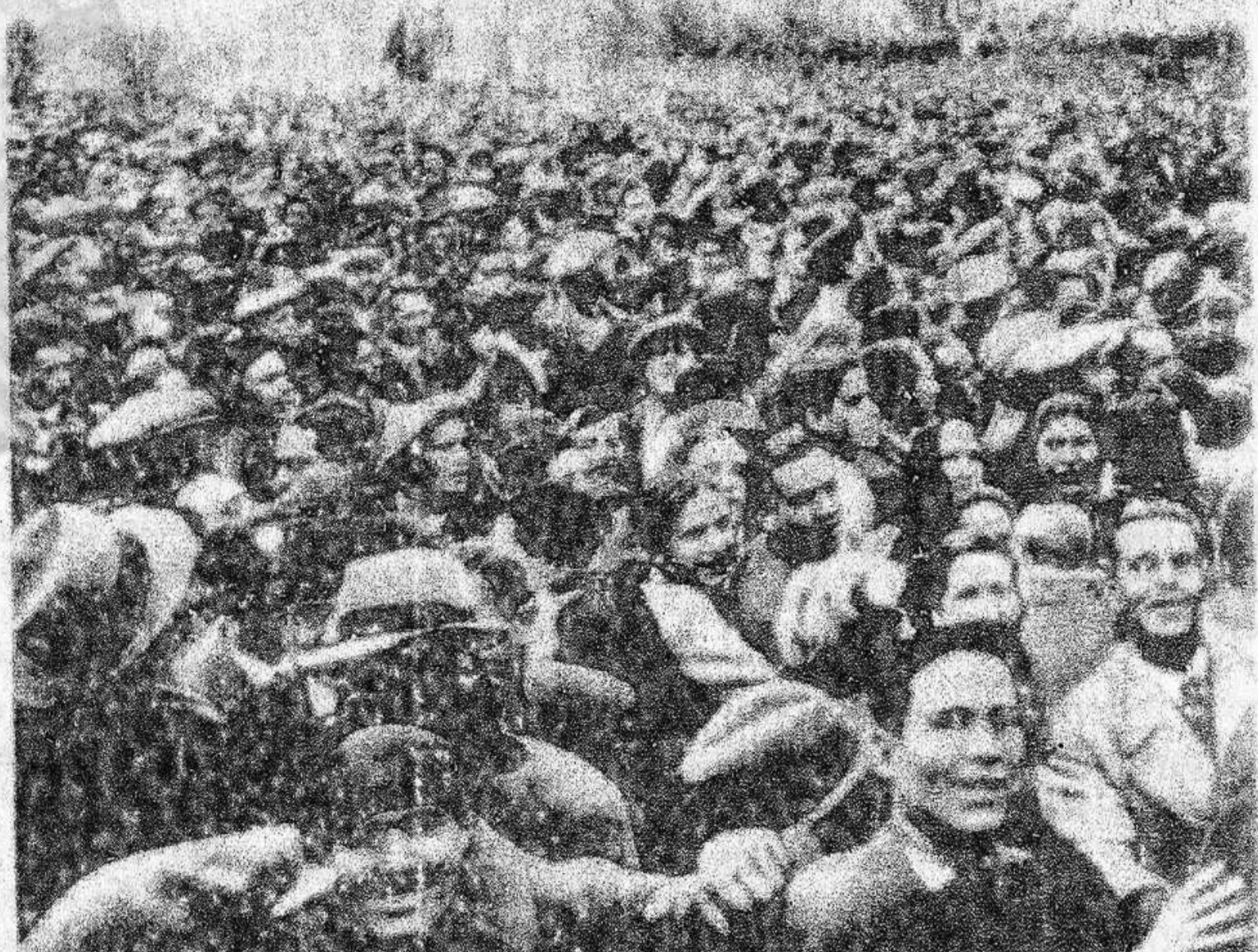
Manifestacion con motivo del triunfo del Frente Popular *

(MADRID) tras las elecciones de febrero de 1938