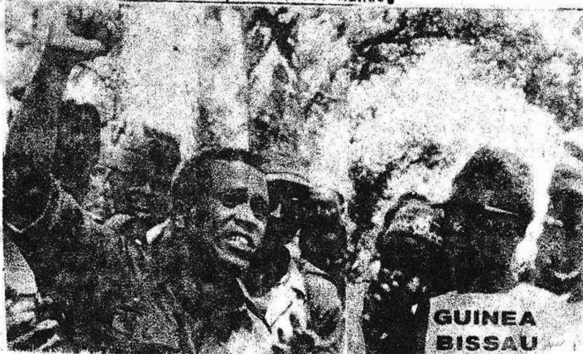
Proclamación de la independencia en 1973

Aunque los 3 pueblos africanos saben muy bien que tendrán que combatir todavía contra maniobras y agresiones de los países imperialistas que sostienen, en provecho propio, al colonialismo portugués, ésta es ya sin duda una importante victoria, que corona más de 10 años de heroica guerra popular. Y un gran triunfo para todos los pueblos del mundo.