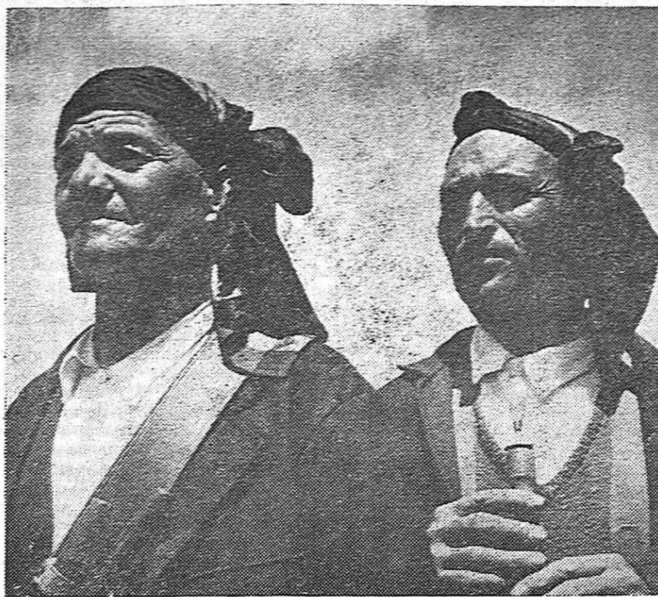
Tipos de Cuenca

Cuando un gobernante destaca ante el ejército la tarea de la lucha contra el "enemigo interior" además de poner de manifiesto su propia debilidad y su fracaso político, destroza a sabiendas el ejército. Así hizo, por ejemplo, Fernando VII al regresar de Francia. Para ello, apoyándose en las bayonetas inglesas que le prestara el duque de Wellington, comenzó por destruir y perseguir a los mejores militares, a los héroes más preclaros de la independencia; fomentó camarillas; infectó las escalas de peniaguados y soplones; (Pasa a la página 4)