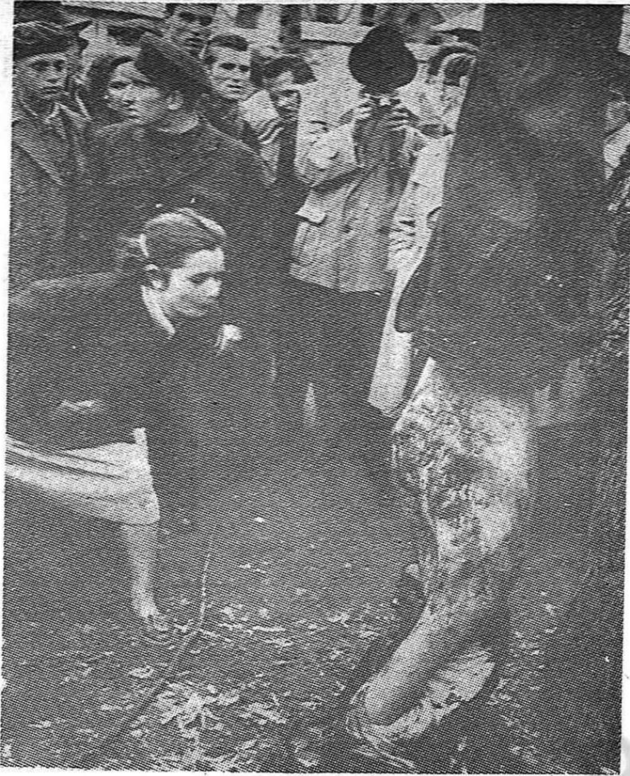
Otra fotografía, tomada de la revista "Life", en la que queda retratada toda la criminal bestialidad de los fascistas húngaros, quienes no vacilaron en exhibir cínicamente los asesinatos por ellos cometidos. Es un ejemplo bien elocuente de lo que la contrarrevolución preparaba para el pueblo húngaro, en caso de que hubiera triunfado.

Si: ese era el plan y tales eran sus alcances. Véase, si no, como