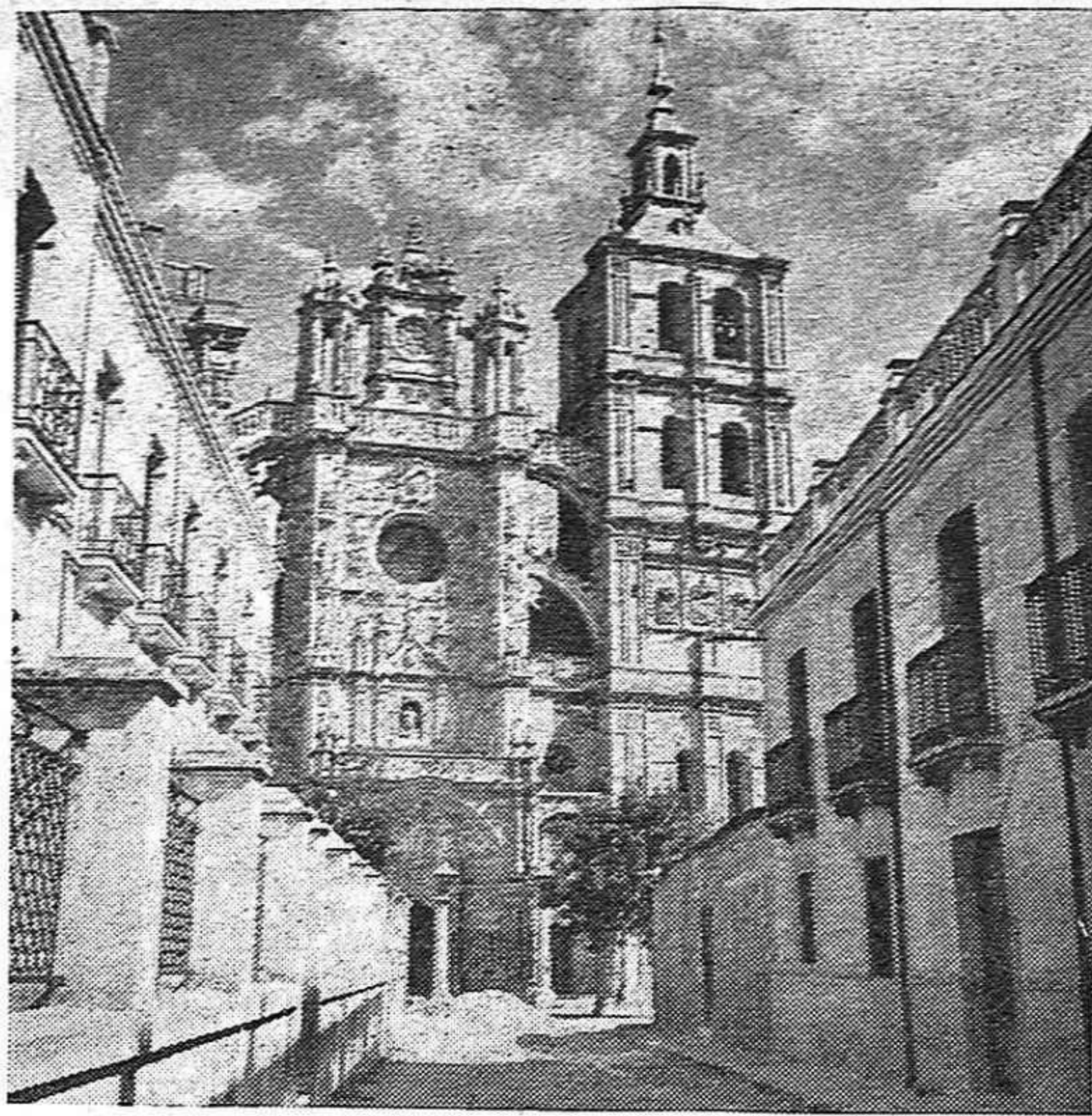
La catedral de León