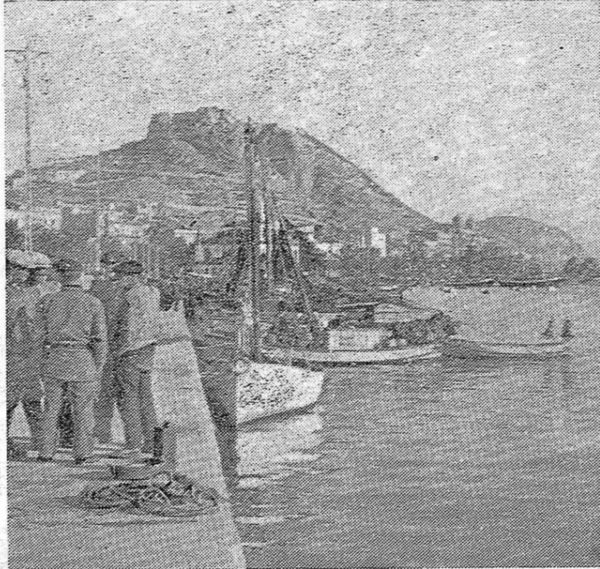
El Puerto de Alicante

¿Se trata, en verdad, de impedir la ingerencia de otros países en el mundo árabe? ¿De evitar la propagación del conflicto? Ni mucho menos. De lo que se trata, única y exclusivamente, es de mantener el "derecho" imperialista de pillaje, cada día más difícil (Pasa a la página 2)