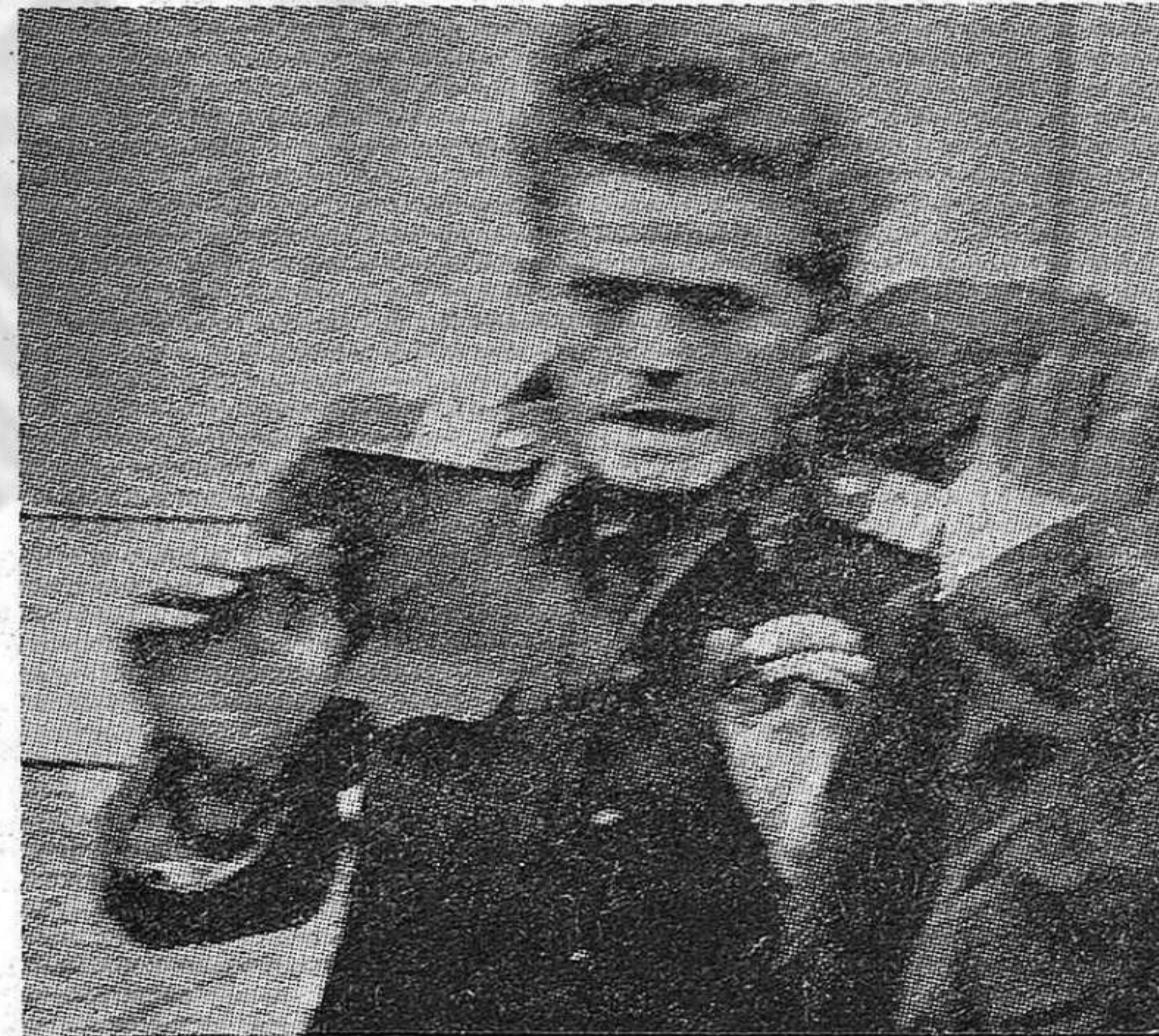
...poco después eran asesinados vilmente, en plena calle, sin haber cometido otro delito que el de defender las conquistas de los trabajadores en Hungría.

4.—Para fomentar la industria y la agricultura es preciso desarrollar en forma adecuada el transporte y el comercio. En el terreno del transporte necesitamos organizar regionalmente todas las fuerzas, continuar el trazado de nuevas vías, realizar la consiguiente reconstrucción técnica de las vías disponibles —sobre todo de los ferrocarriles, que funcionan con mayor tensión— y utilizar al máximo los medios de transporte de la población. En el campo del comercio, con motivo de haberse realizado en lo fundamental las transformaciones socialistas de la industria y del co-