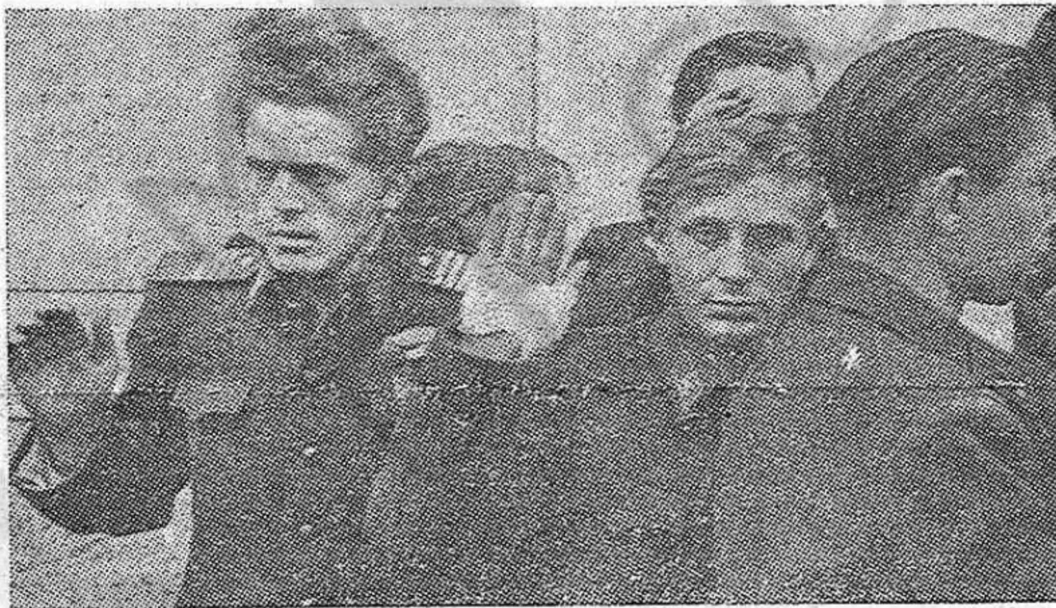
No se trata de agentes de la policía secreta, como dice la revista "Life", de la cual ha sido tomada esta fotografía. Son, simplemente, soldados. Y el de la izquierda tiene el grado de sargento. Tomados prisioneros por los fascistas húngaros...