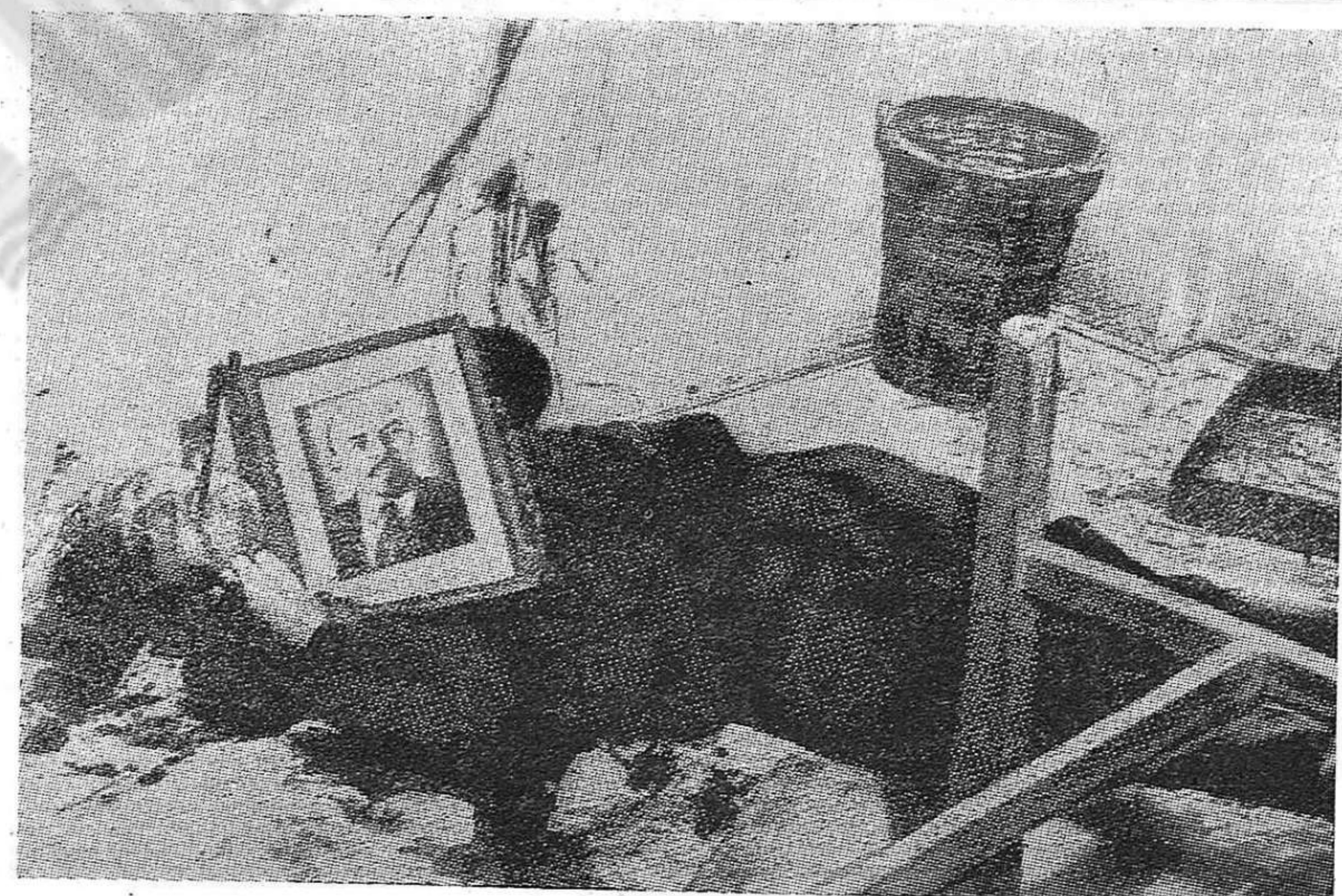
Uno de los horripilantes crímenes cometidos por los verdugos fascistas en Hungría. Es el local yace el cadáver de un comunista que defendió el poder popular. Los criminales torturaron largamente a su víctima, como demuestran las manchas de sangre en la pared. Al final, clavaron su cabeza en el suelo con una bayoneta y entre sus manos colocaron un retrato de V. I. Lenin.

Un triunfo está seguro en los Juegos Olímpicos: el del fortalecimiento de la amistad entre los deportistas de todo el mundo, quienes contribuyen así a estrechar los lazos amistosos entre sus países.