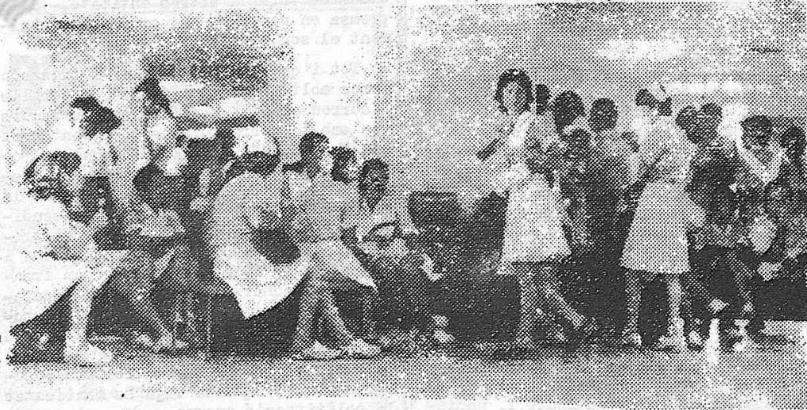
Assemblea d'infermeres a Bellvitge