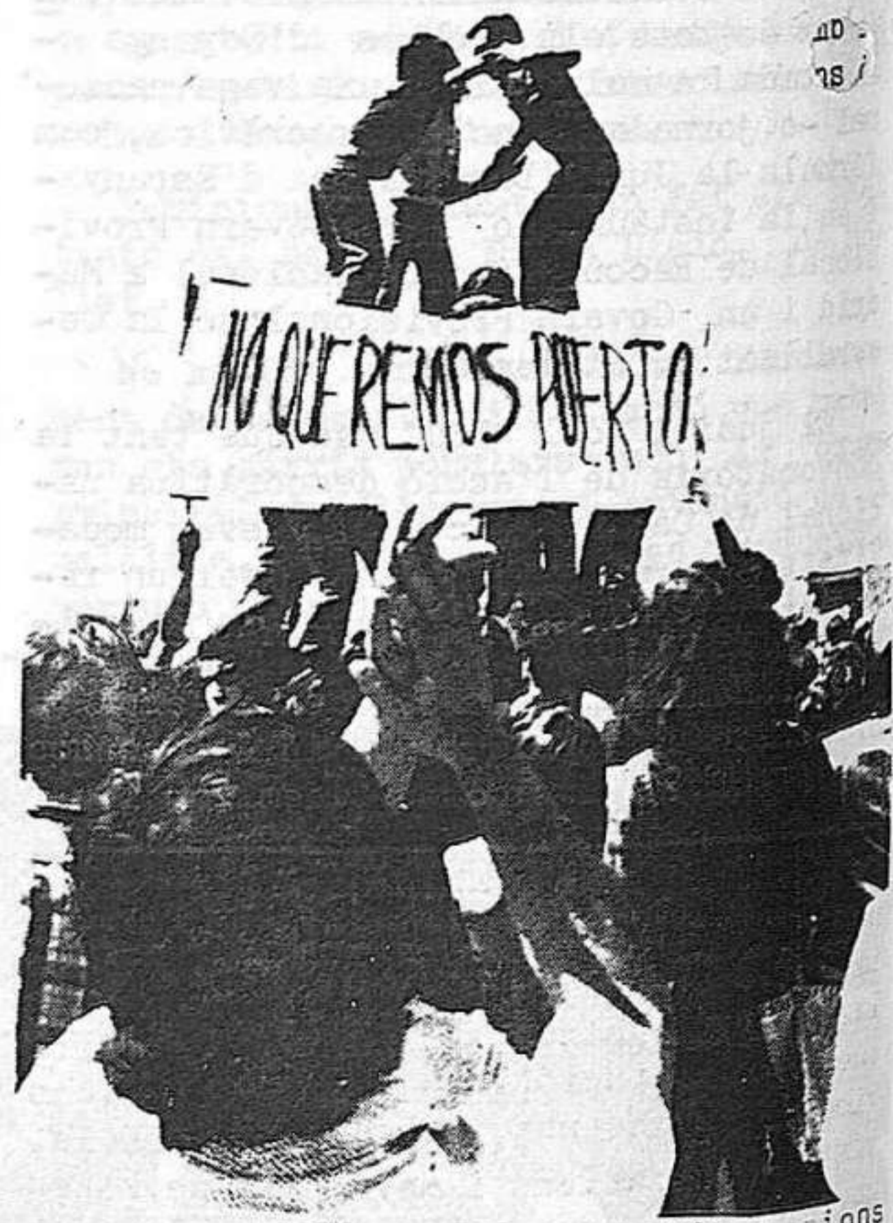
Aspecte d'una de les manifestacions a la platja contra el projecte del port esportiu, que el poble no vol.