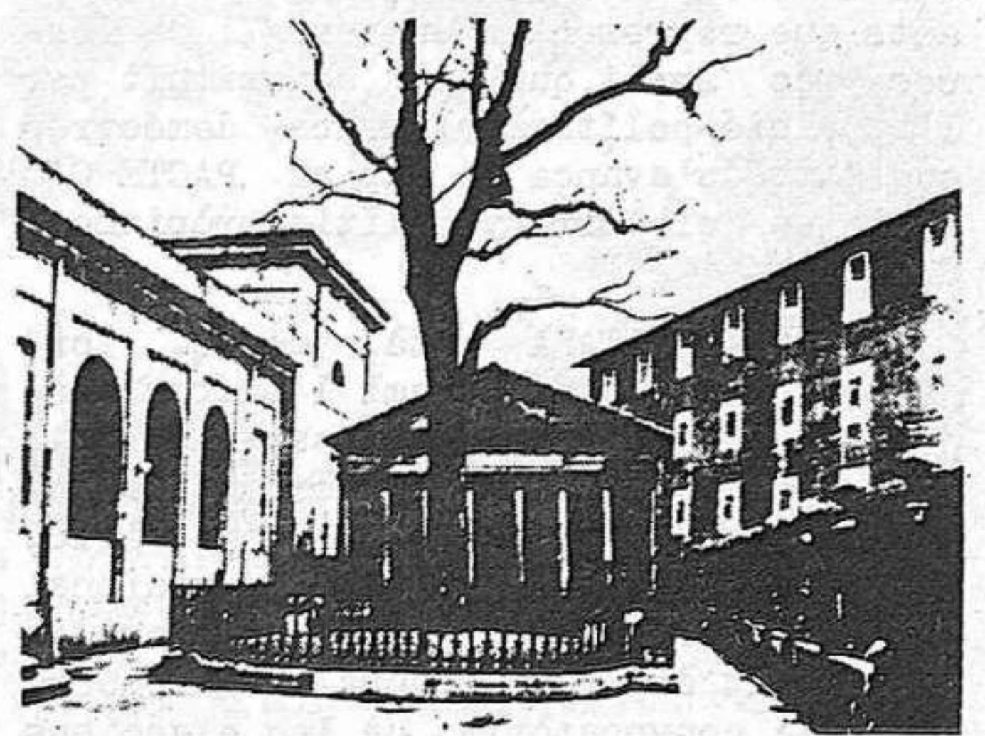
L'arbre de Guernica, símbol de les llibertats d'Euskadi.