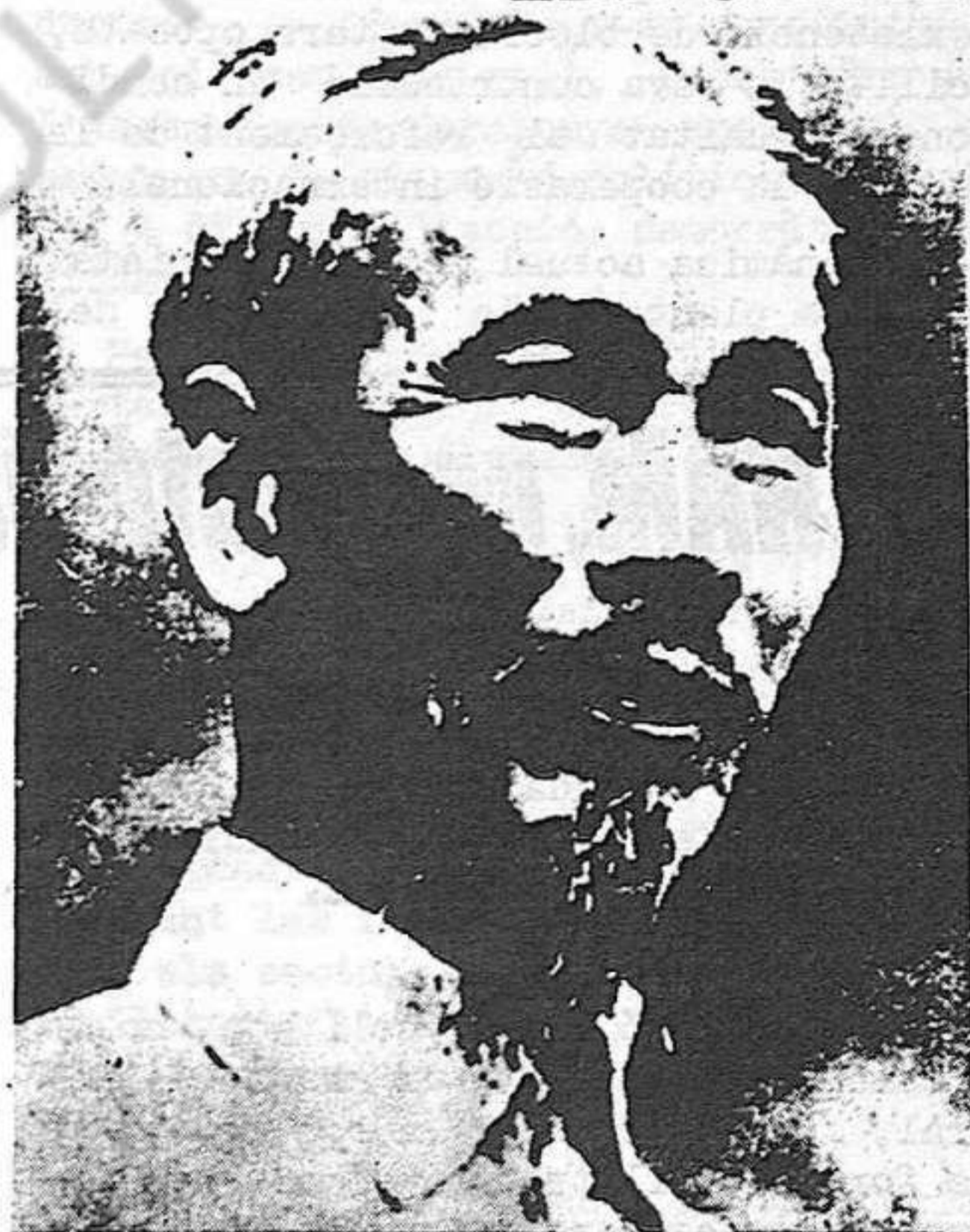
Ho Chi Minh

La rendició incondicional del govern de Vietnam del Sud a les forces patriò- tiques ha coronat el llarguíssim calva- rri del poble vietnamès amb una victòria esclatant i merescuda, que, per molts conceptes, es pot qualificar d'històri- ca.