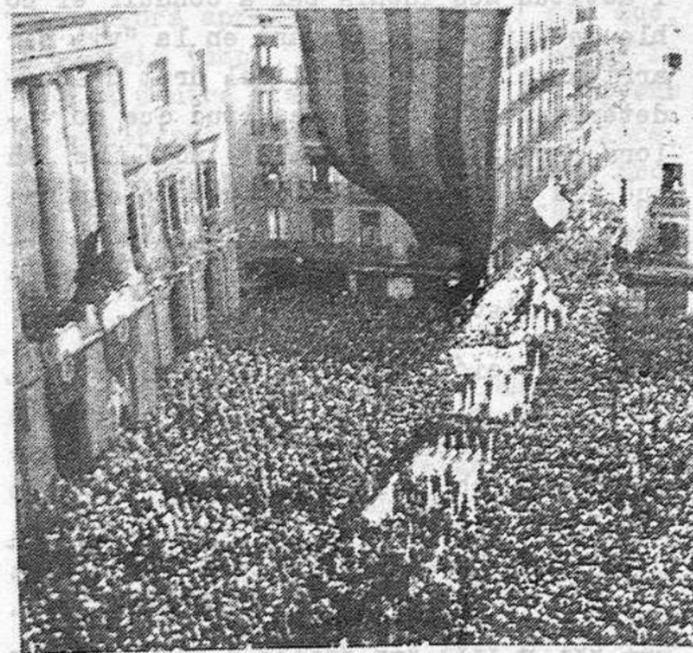
Manifestació el 24-9-1932 per celebrar l'aprovació de l'Estatut

D'altra banda, quina incompatibilitat hi ha entre la formulació del punt 9è de la Junta i la reivindicació programàtica de l'Estatut de 1932 per part de la Comissió Coordinadora de Forces Polítiques i de l'Assemblea de Catalunya? El restabliment de l'Estatut del 32 es fa dintre (passa a la pàg. 2)