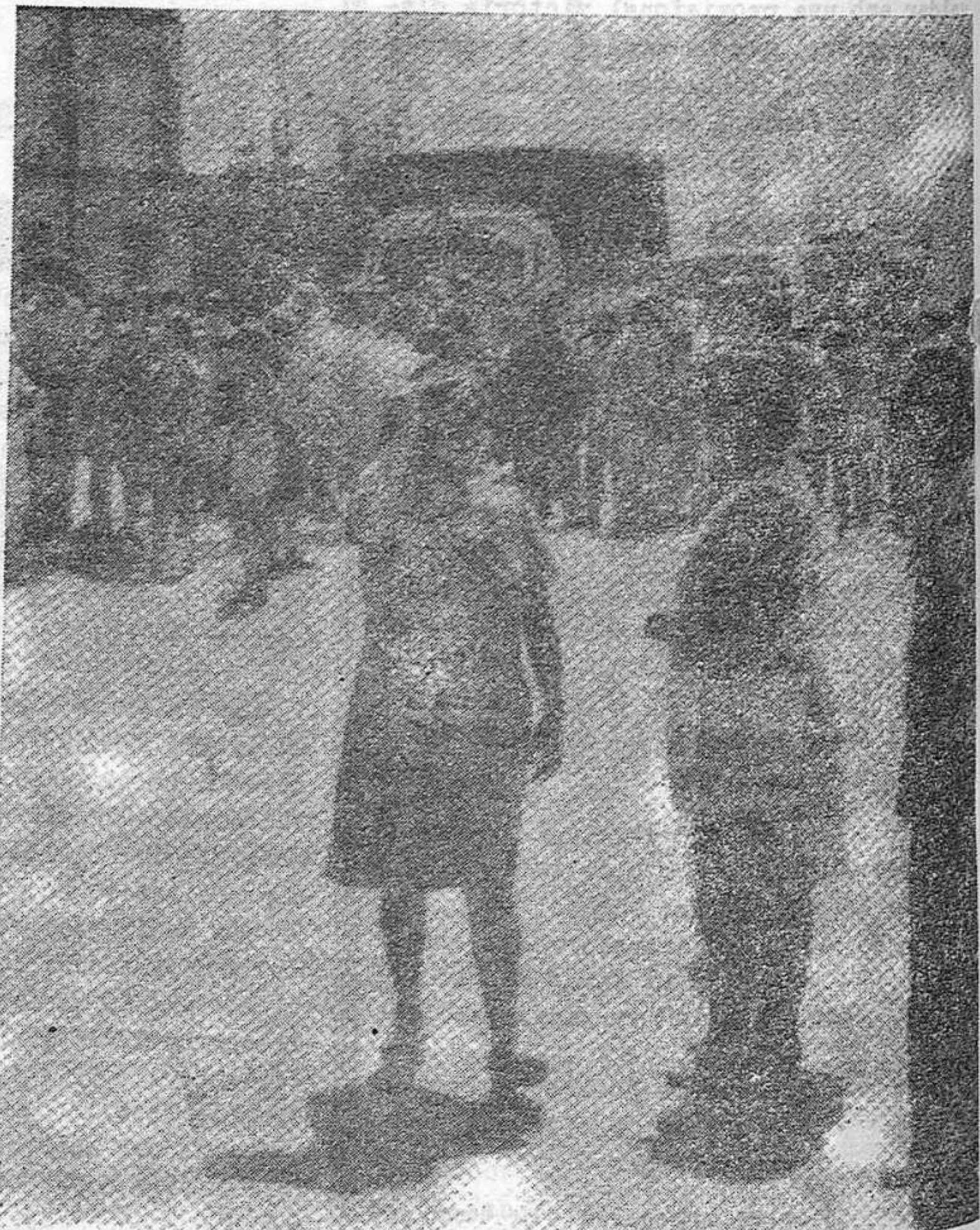
La manifestació de Carmona que la Guàrdia Civil va regar amb sang.

La fotografia de sota és del mateix diari.