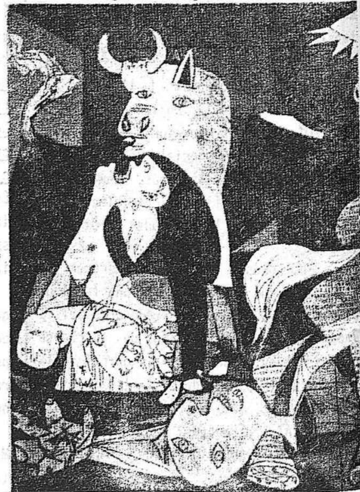
Fragment del quadre "Guernica"

Malgrat els seus 92 anys, la seva fecunditat creadora mai no s'havia aturat. La seva desaparició és una pèrdua immensa que ens afligeix.