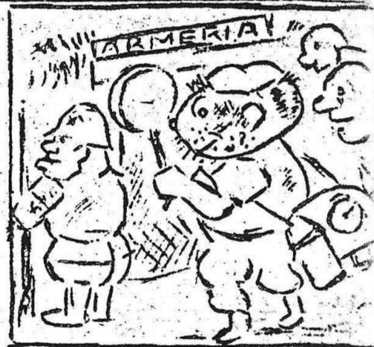
3. Con silencio y sangre fría se acercan a la armería.