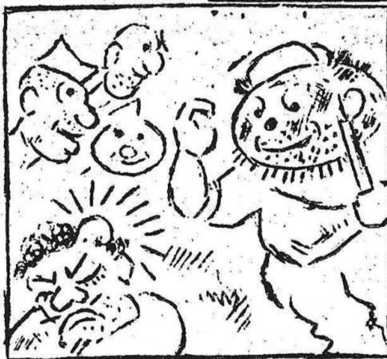
2. Y deciden la evasión llevándose municion.