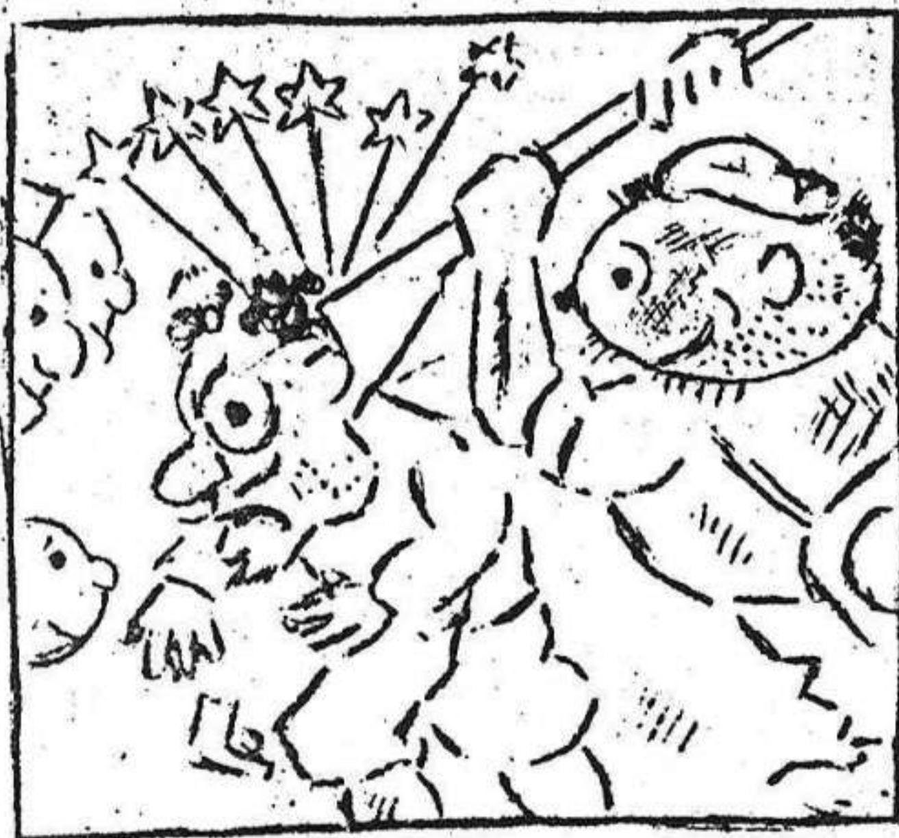
1. En la cabeza "ondukata" le zumba con la culata.