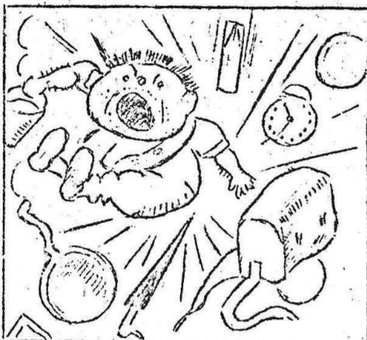
2. Le pegan cuatro bombazos que le dan el gran sustazo.