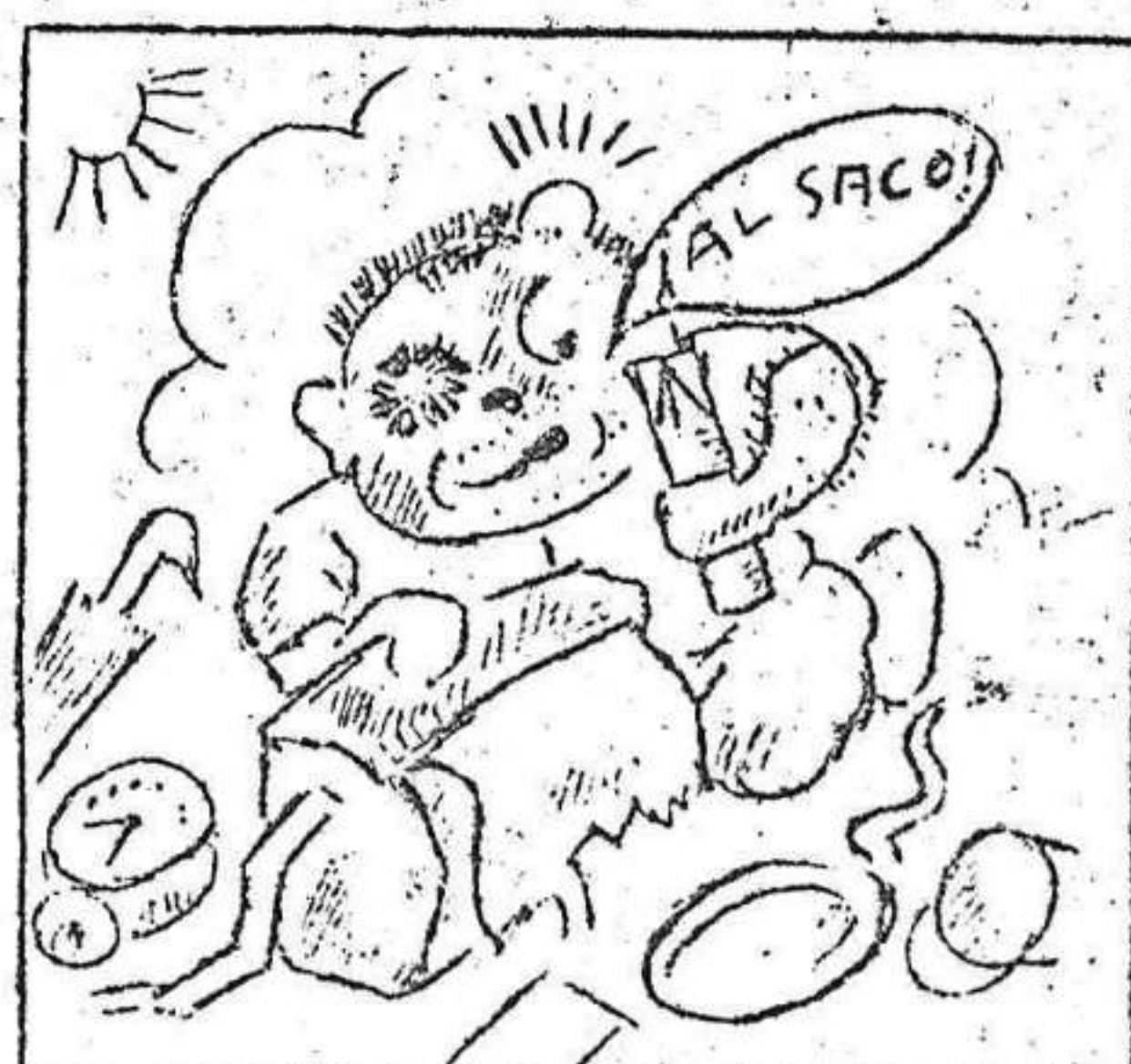
3. Una bomba no estalló y en el macuto la echó.