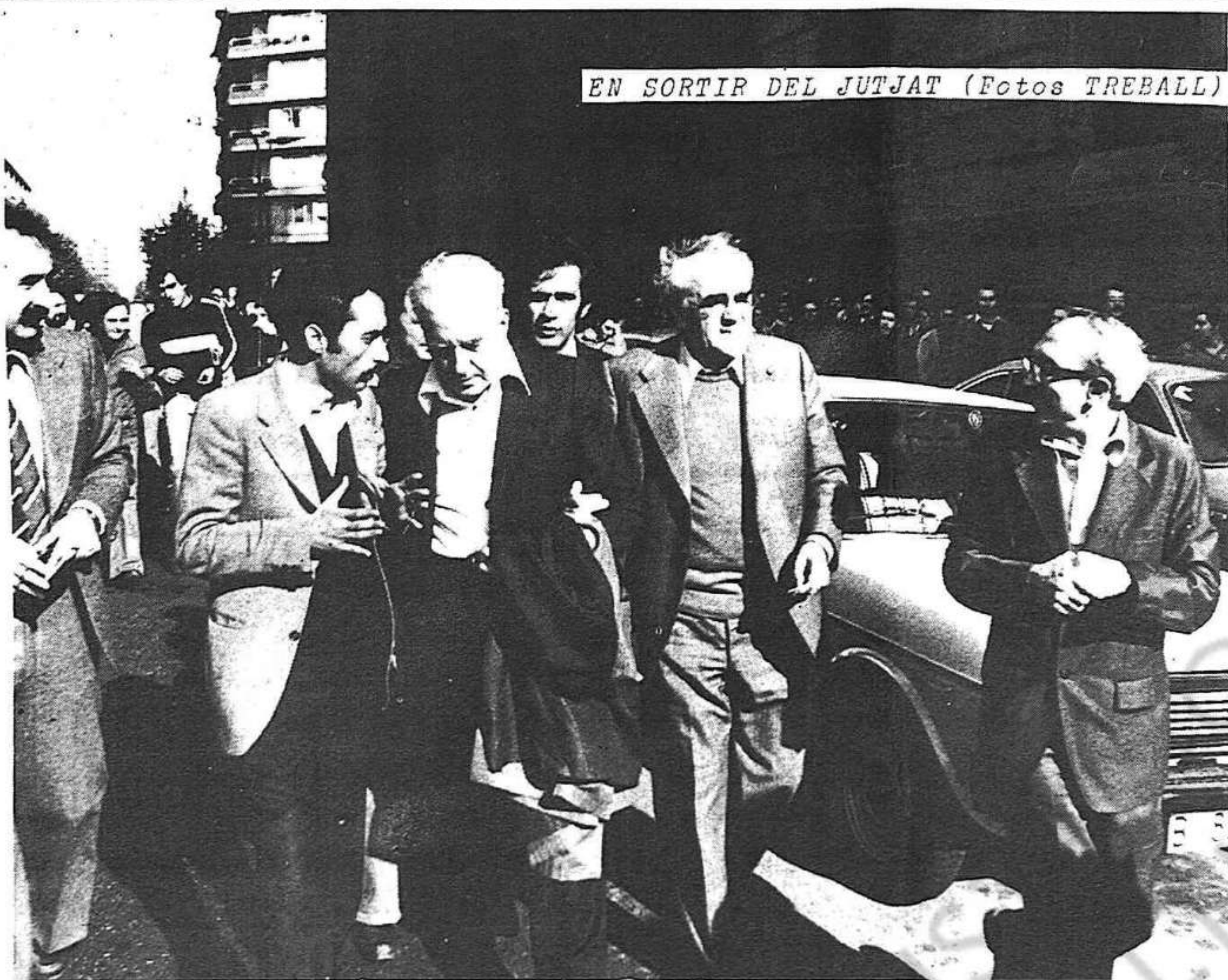
EN SORTIR DEL JUTJAT (FOTOS TREBALL)

NINGÚ NO RESTA INACTIU DAVANT LA DETENCIÓ