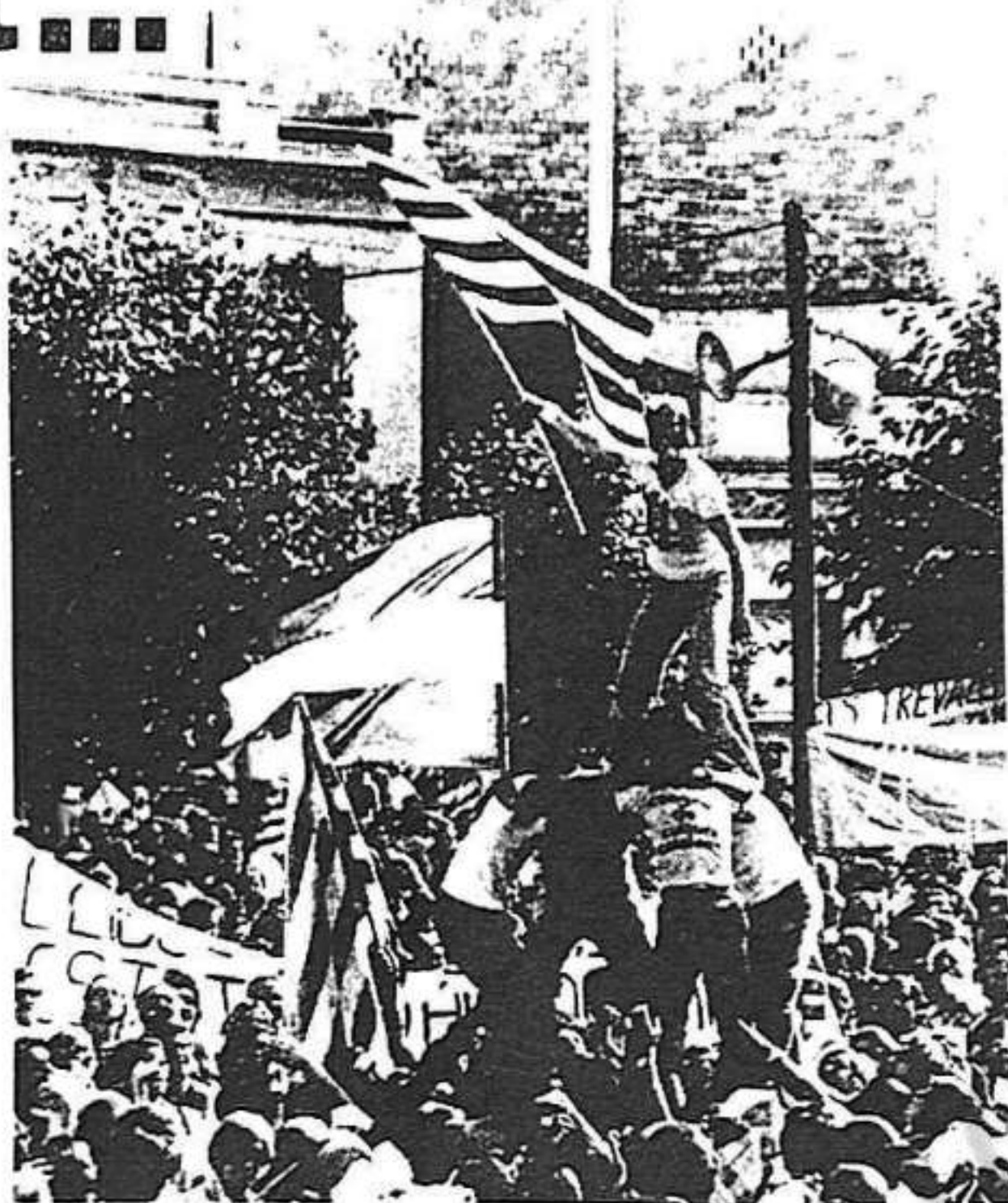
l'òrgan o dels òrgans capaços d'impulsar-la a nivell de tot l'Estat.

Decidir la negociació per separat, només des de Catalunya, no solament és utòpic. És condemnar-se a la impotència i afeblir la capacitat negociadora de