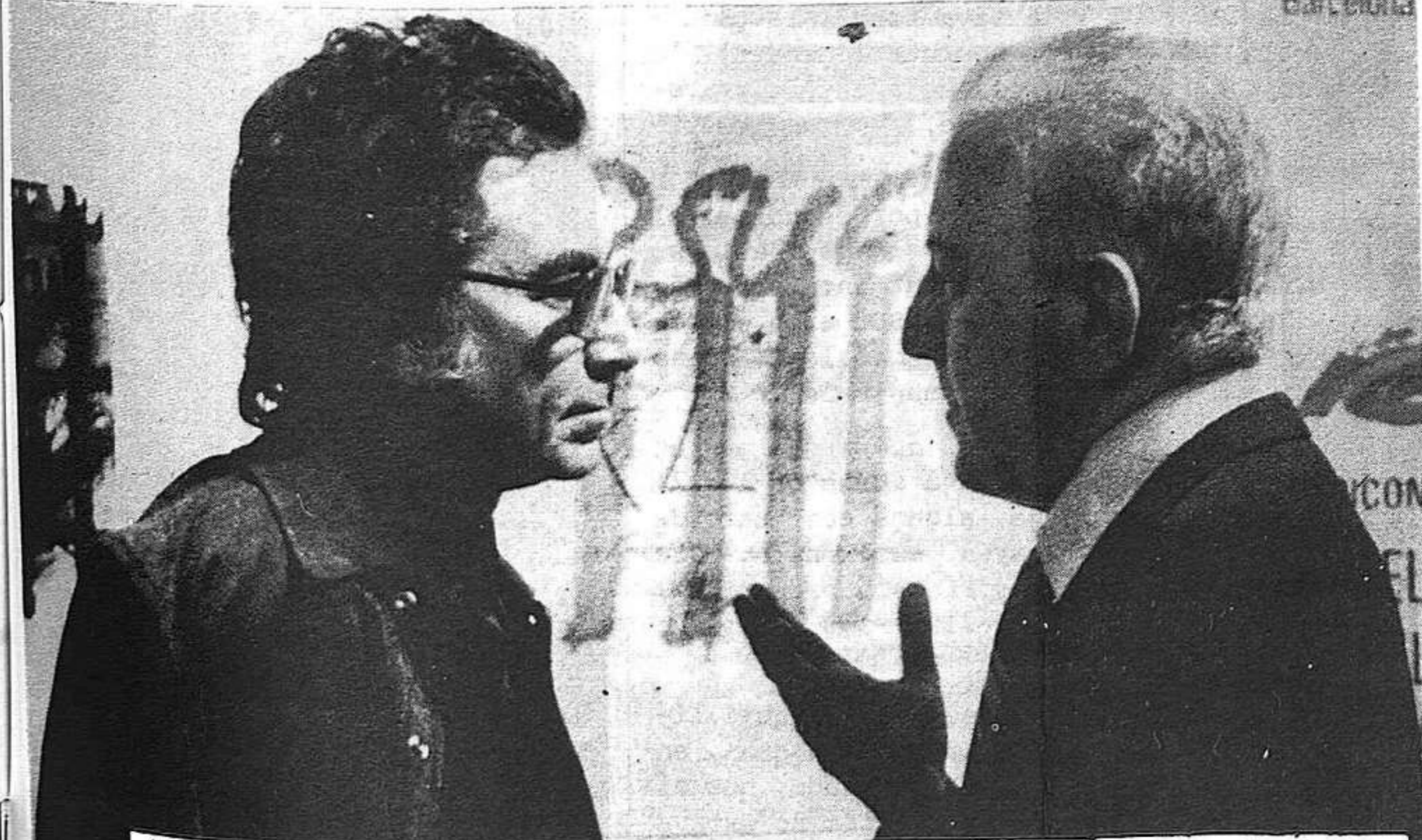
A l'exposició Tàpies, de la Fundació Miró, amb el pintor