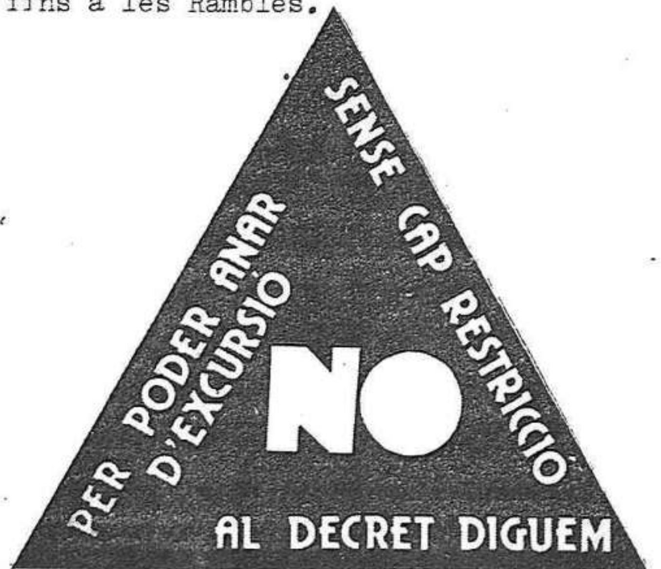
Etiqueta de protesta contra el decret.

El diumenge 26 de gener uns 3.000 joves es van concentrar a la Pl. Sant Jaume de Barcelona per protestar contra el decret d'acampada que denunciàvem al número anterior i que és una autèntica provocació per les mides de control ideològic i burocràtic que el feixisme pretén imposar. Després de cantar cançons i cridar contra el decret, van marxar fins a les Rambles.