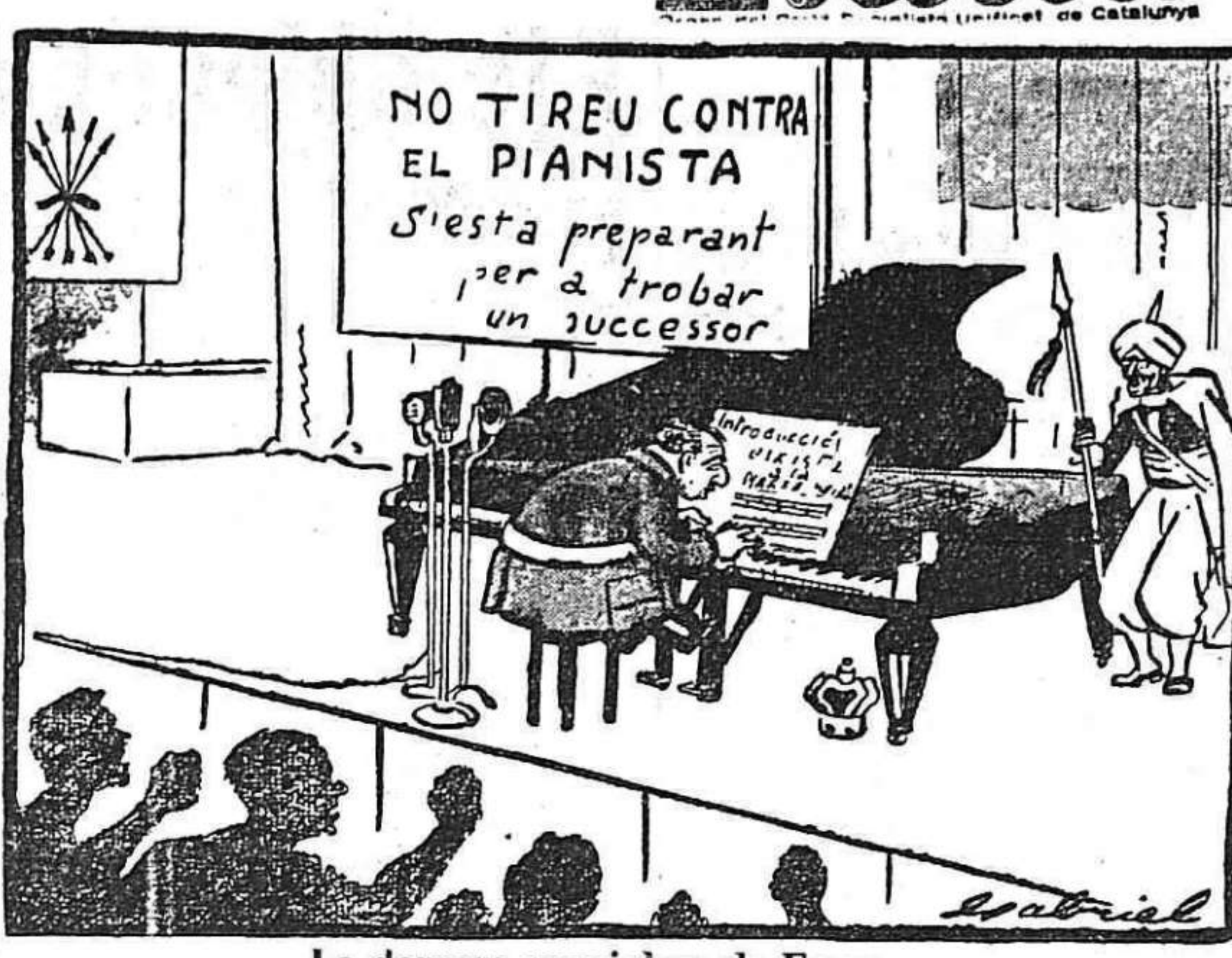
La darrera maniobra de Franco

«L'existència d'aquests monopolis no són tan sols la ruïna dels petits industrials, sinó que són la misèria per a tot el poble i fonamentalment per a la classe obrera, que l'obliga a viure amb uns jornals de fam i de misèria».