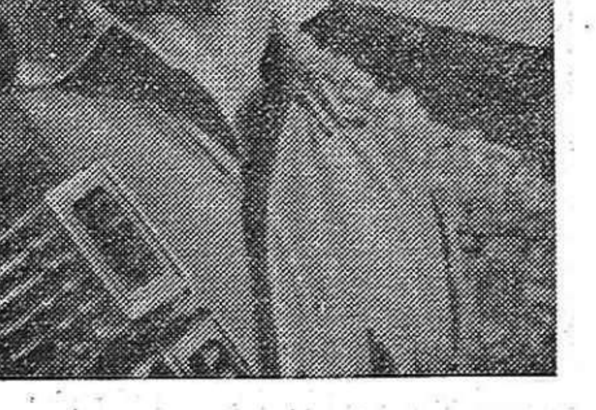
Soldat de l'heroic Exèrcit democràtic grec, comandat pel general Markos.

Segons totes les informacions, l'anomenada ofensiva de primavera que el Govern monàrquico-feixista de Grècia va emprendre contra l'exèrcit democràtic i els patriotes del seu país ha fracassat. Les raons que donen els comunicats de guerra del general en cap de l'exèrcit del rei Pau a recordar com una altra gota d'aigua, els comunicats de l'exèrcit hitleria, quan va sofrir les primeres derrotes que al front de Stalingrad.