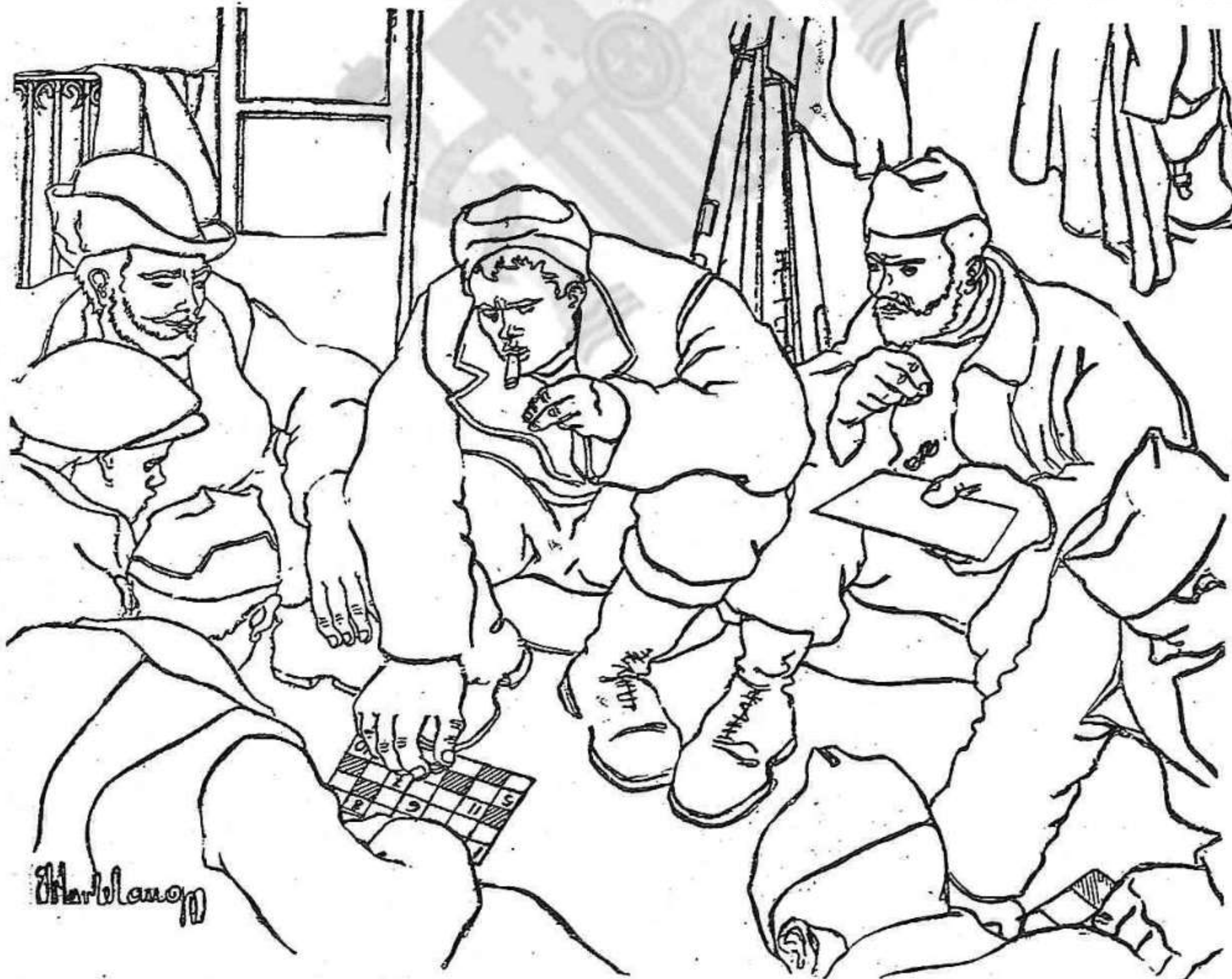
Milicianos durante un descanso. (Apunte del natural, por Hortelano.)

los que, unidos, luchan por una misma causa.