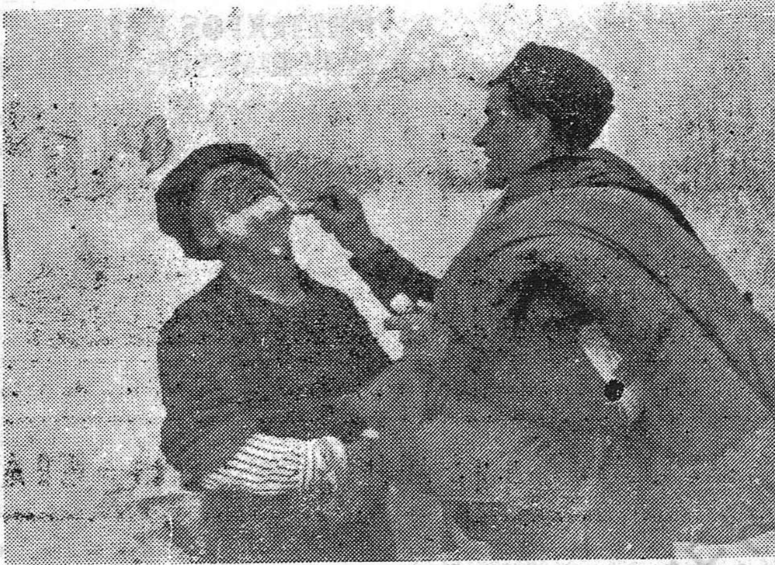
ESCENAS DEL FRENTE.—El sanitario aprovecha un pequeño descanso para hacer de barbero.