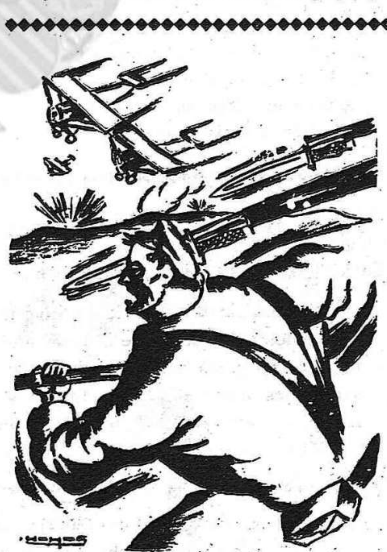
En el ataque está la victoria

El 10 salí de Baza con unos camaradas de Galera, que me llevaron en su coche hasta Huéscar. En Galera, de paso para Huéscar, fui a visitar las organizaciones sindicales y políticas, U. G. T., P. S. O. E. y Partido Comunista; me reuní con todos ellos en uno de sus locales, y supe que en Galera estaba sin organizar la Juventud Socialista Unificada; que, además, la Unión General de Trabajadores se consideraba independiente de los dos partidos políticos que representan al proletariado; les aconsejé que constituyeran una Juventud Socialista Unificada y que yo