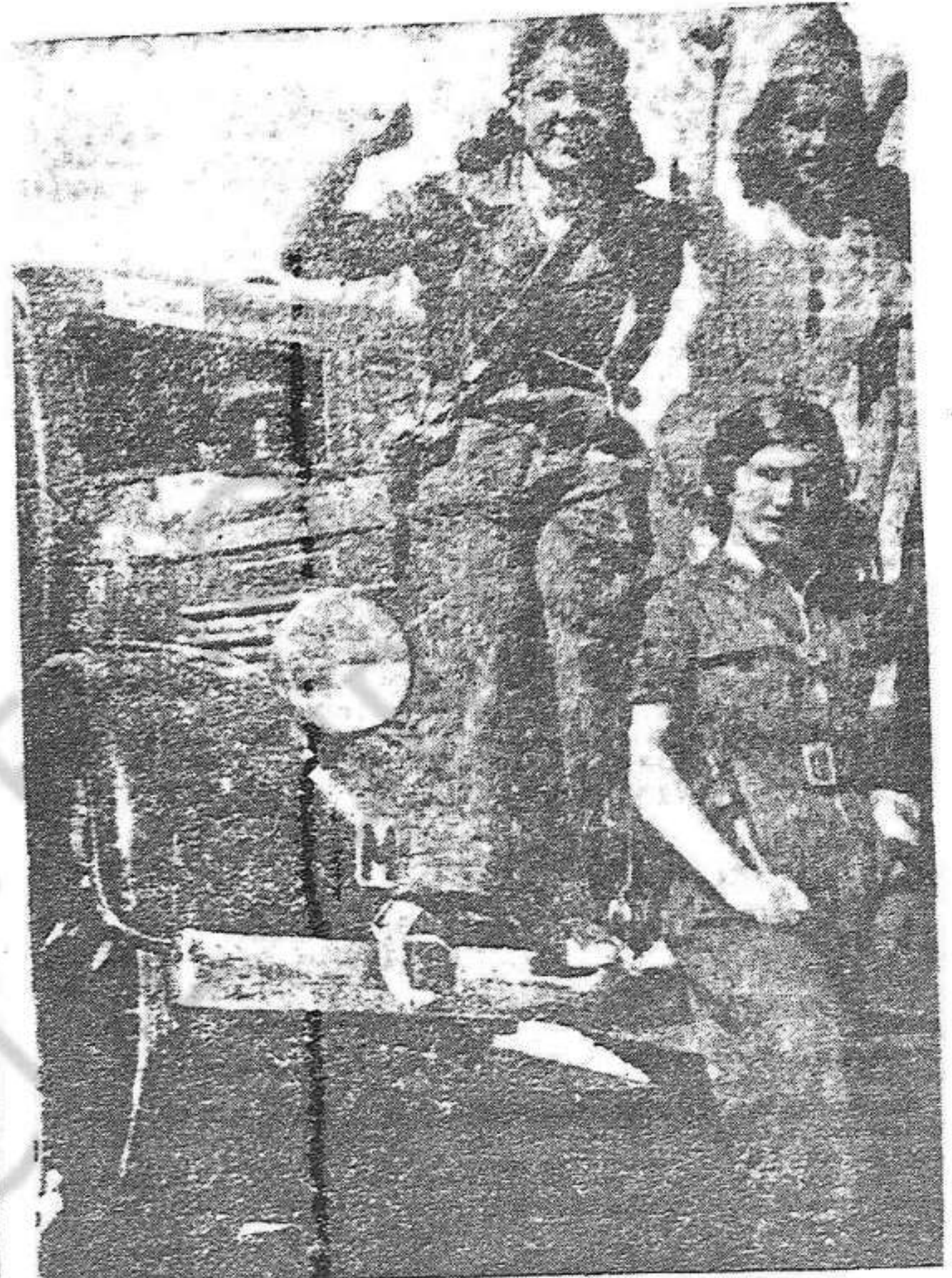
Les dents lluites junt amb les millores i els soldats contra els bandits feixistes. Momen aci en un moment de repòs. (Perucho)

Per fi, el dia 4, vaig poder sortir. Vaig arribar als primers llocs ocupats per les columnes catalanes i des d'allí ja tot va rutllar com una roda. Així que vaig sentir parlar català, ja em vaig veure natural. De Saragossa, fins la impressió que els obrers no han esperat al feixisme la resistència que són capaces d'oposar, perquè els van agafar de sorpresa, i perquè els van detenir els dirigents, alguns dels quals van ésser afusellats. Jo ara que sé així que les columnes catalanes arriben a les portes de Saragossa, els obrers saragossins es rehabilitaran instant com a feres. D'Osca ja ho he dit. Així que els catalans hi entrin, no estament s'aixecarà el poble, sinó que podran comptar, també, amb la guarnició.