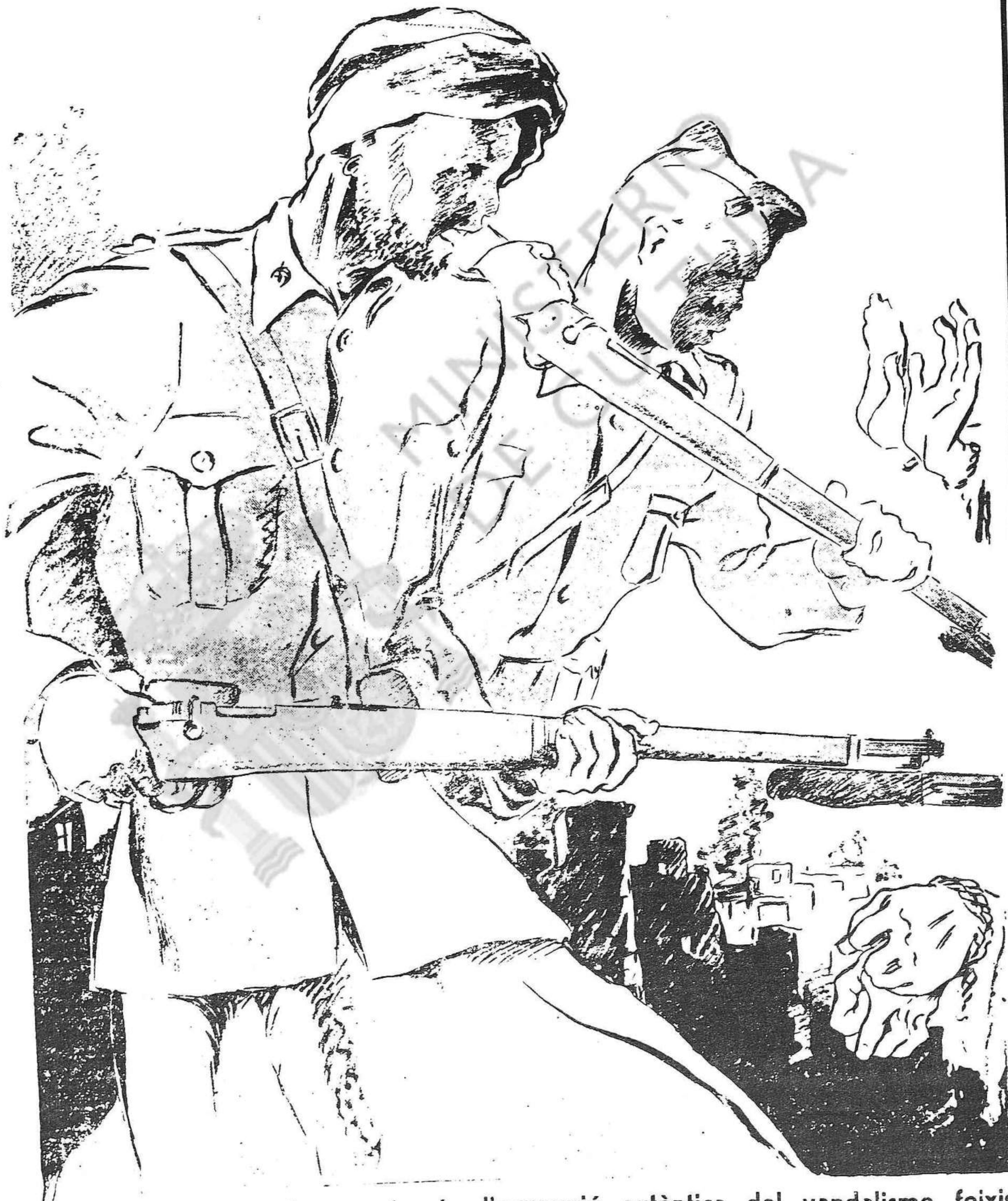
Aquests salvatges i degenerats són l'expressió autèntica del vandalisme feixista (Per Negro, del Sindicat de Dibutants Professionals U. G. T.)