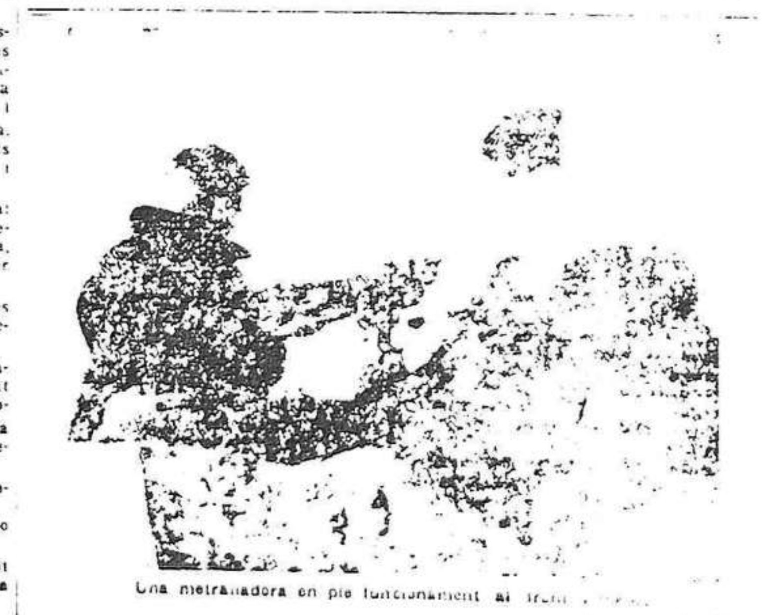
Una mitranadora en ple funcionament al front de Mèlida