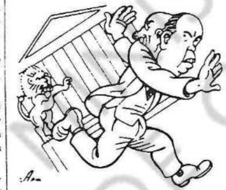
Bufa! Comença a ésser hora de dir que no hi erem!