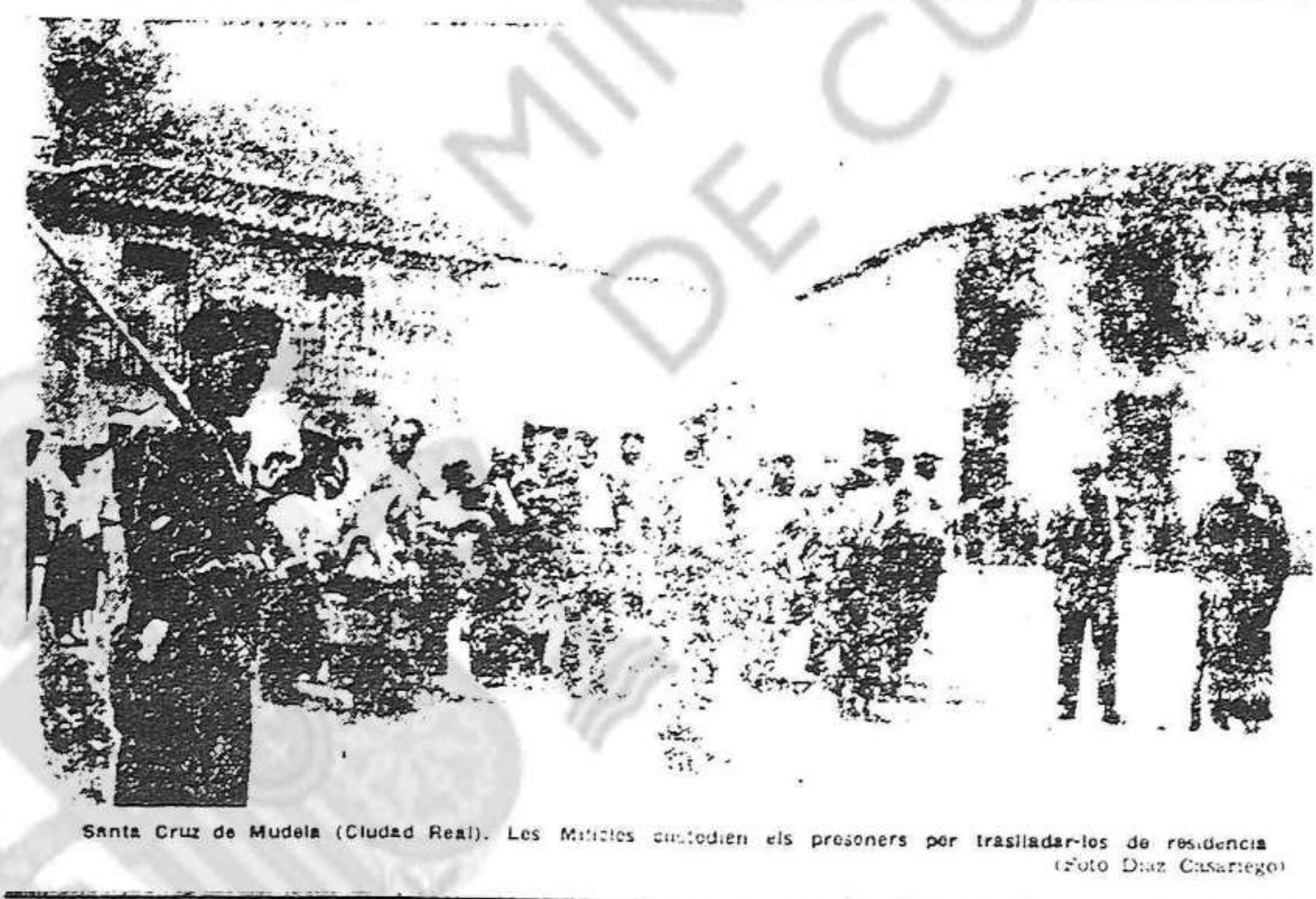
Santa Cruz de Mudela (Ciudad Real). Les Milícies custodiaven els presoners per traslladar-los de residència

Un altre dels perillosos és un comerciant de la vila, el qual va haver d'ésser transportat a l'hospital a causa d'una ferida que voluntàriament es va fer per tal de no continuar a la presó. —M'han dit que sou feixista? —Us han enganjat — va contestar-me amb convicció. — Jo no tinc idees polí-