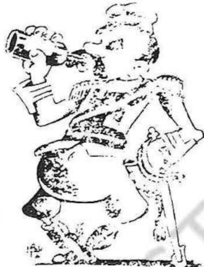
Queipo de Llano i el Charlot de la militarada