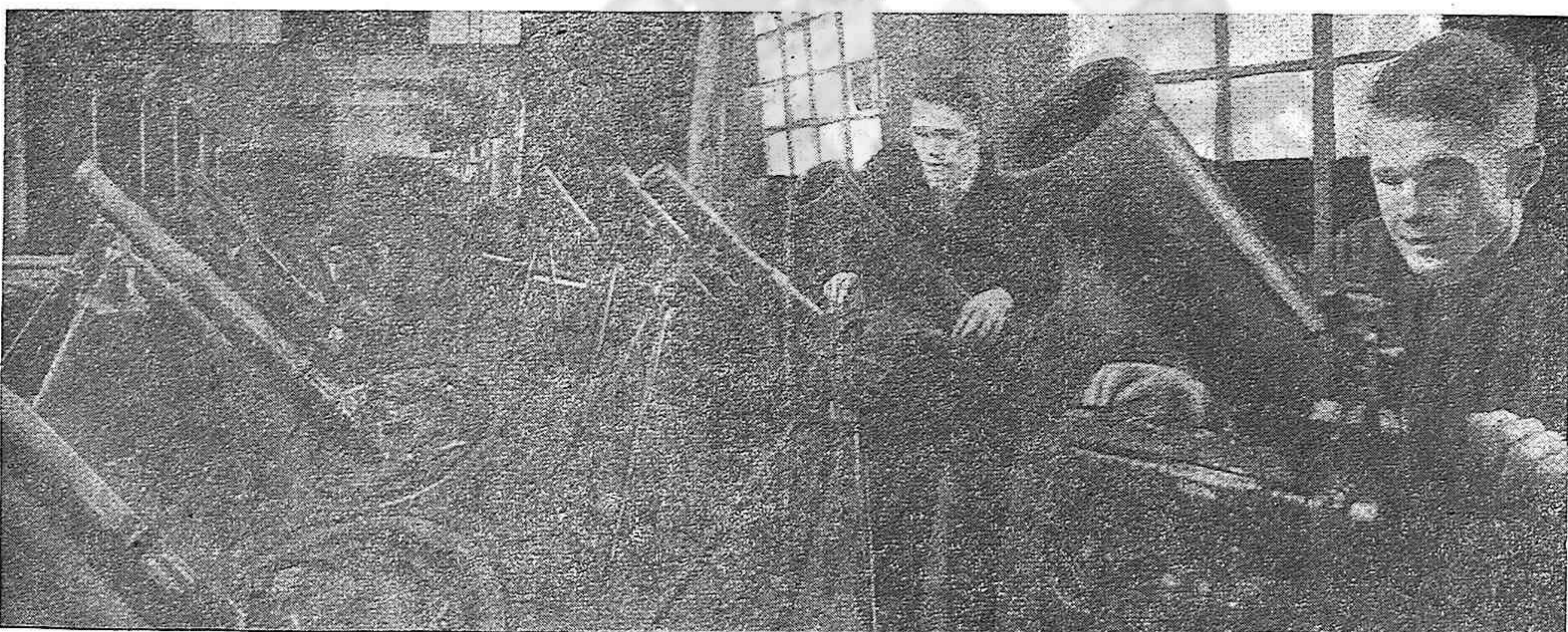
Una fábrica de morteros en la Unión Soviética.

Nuestro pueblo no debe dejarse engañar por los cantos de sirena franquista. Sabiendo como sabe que Franco y Falange siguen enviando hombres al frente oriental es necesario y urgente levantar la neutralidad, con este hecho (Pasa a la Pág. 2)