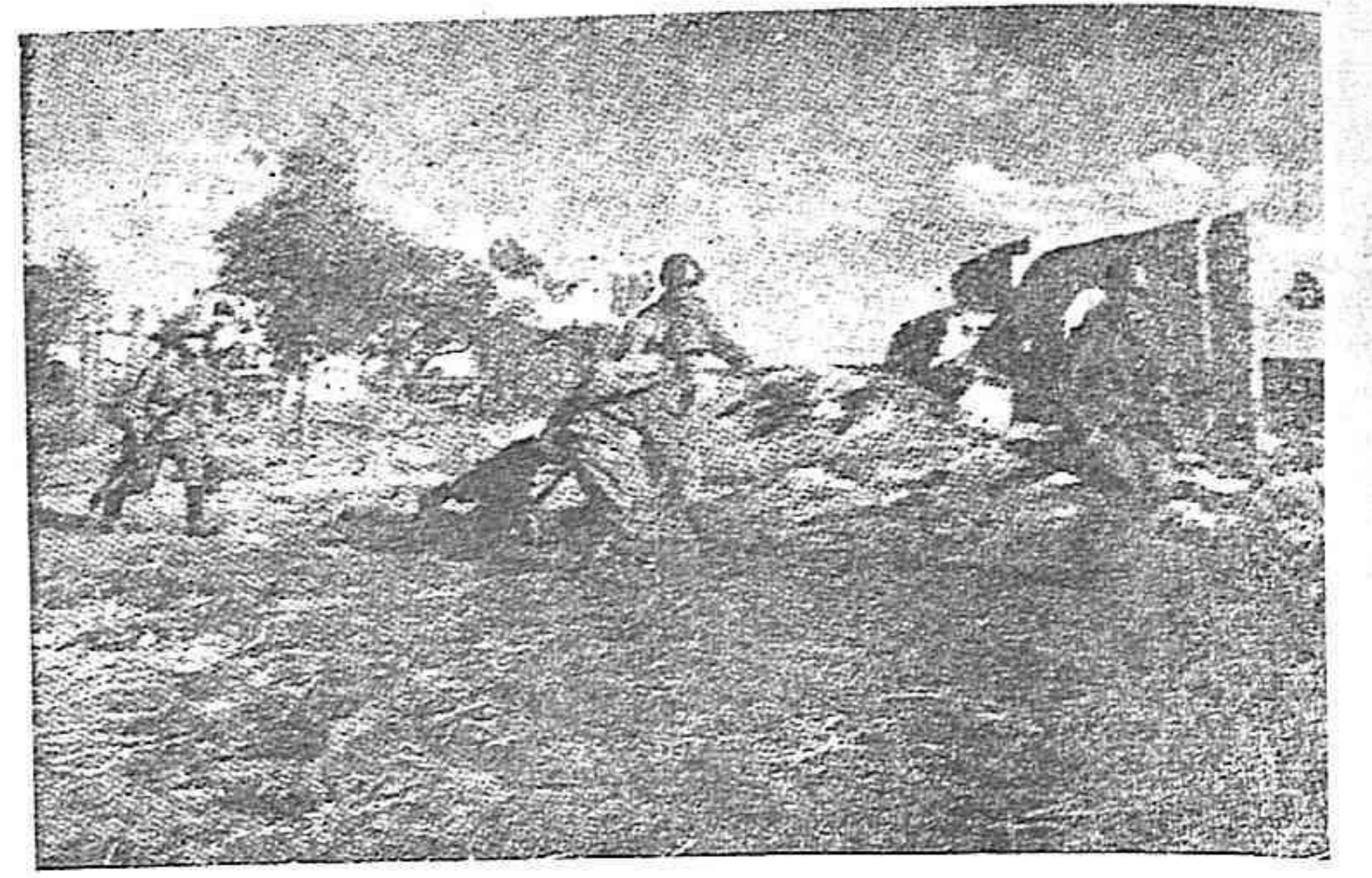
Un avance soviético.

Los ojos de este muchacho conservan todavía el horror de aquella vida dolorosa, sangrienta, en que el hambre, la miseria más espantosa y las persecuciones más atroces forman el ambiente dominante. Esta muchacha española, madrileña, ha estado varios años en la cárcel de las Ventas, destinada a prisión de mujeres.