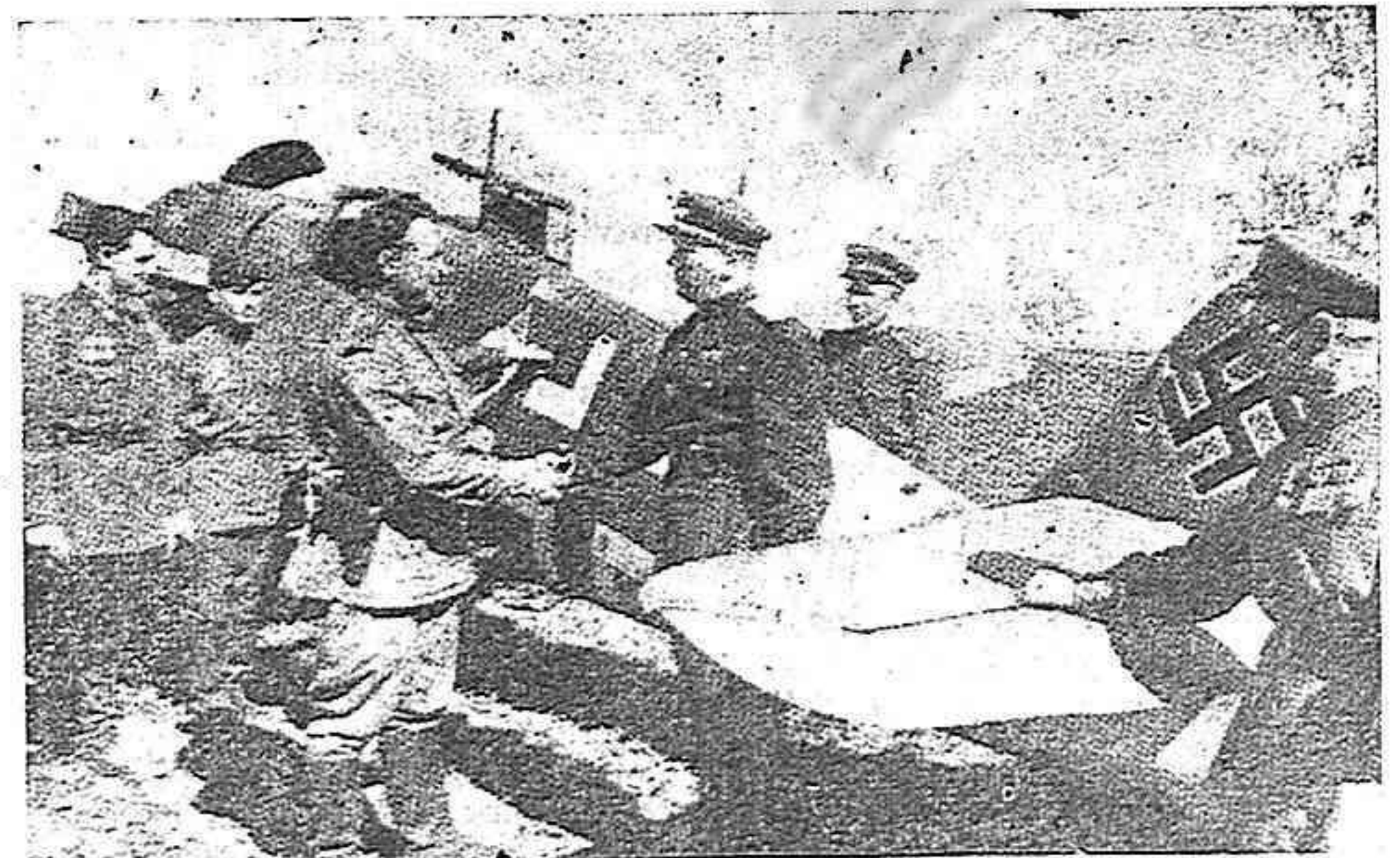
Un aviador soviético recibe la felicitación de sus jefes.