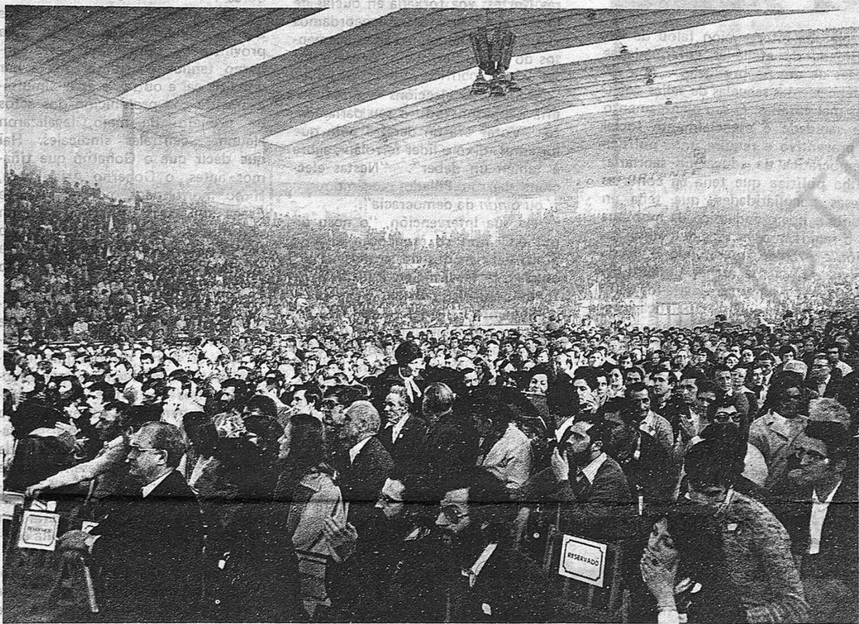
Implantación na realidade e no pobo galegos dunhas siglas

O Pabellón dos Deportes de Vigo, o día 30 a eso das sete da tarde, era como un mar de obreiros, labregos, profesionais e estudantes, do que emerxían dúcias de bandeiras roxas, galegas e españolas. As veces, no calor do mitin, subía a marea, desbordábase a emoción e as ondas deste mar progresista erguían puños solidarios, aplausos democráticos e berros de liberdade. Houbo algúns intentos boicoteadores e irresponsables que non conseguiron amainá-lo entusiasmo de máis de sete mil persoas -militantes, simpatizantes, democratas, convidados- que testificaron, coa súa presenza, a implantación na realidade e no pobo galegos, dunhas siglas: ¡PCGG!