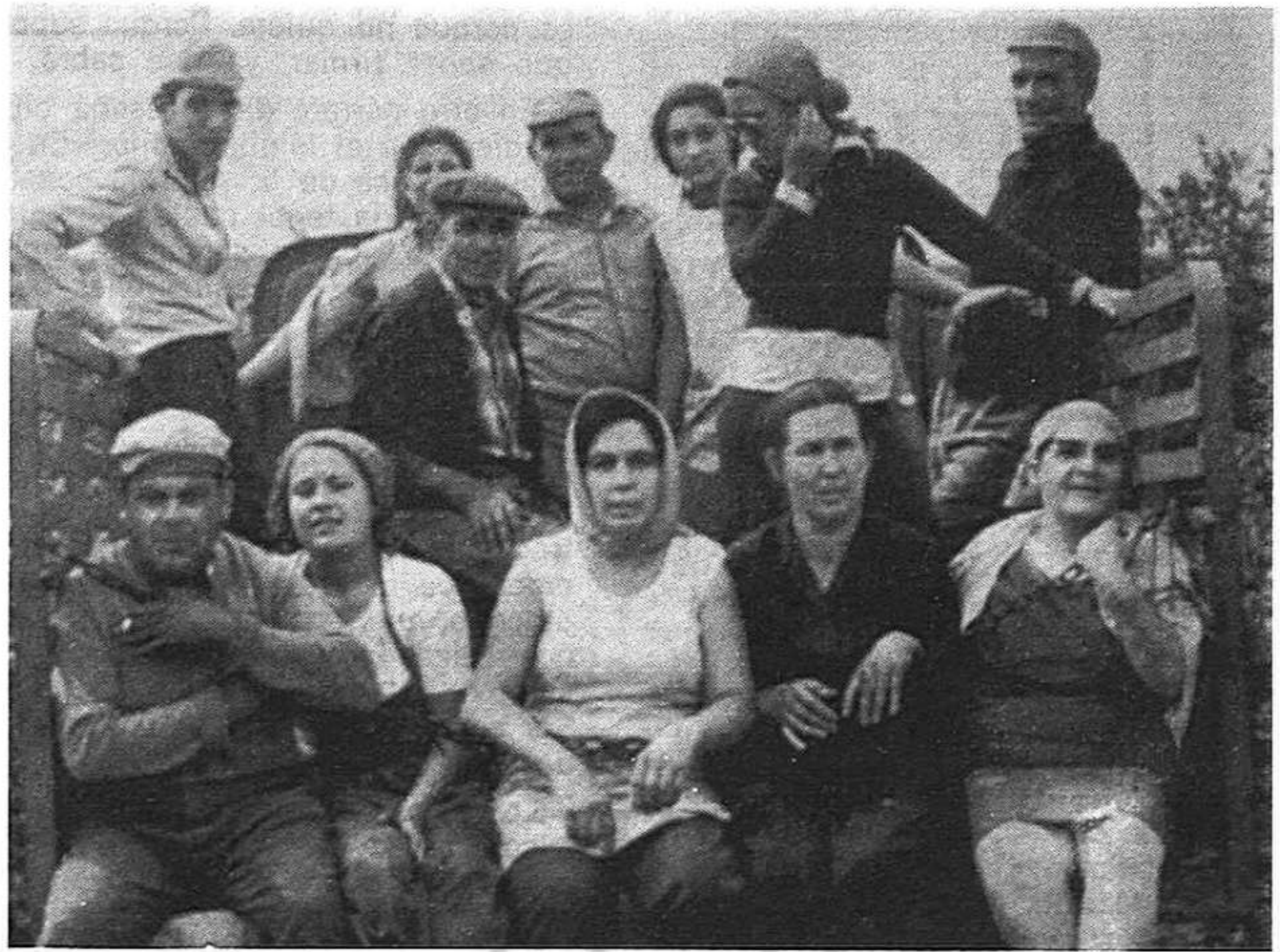
...«uno de cada cuatro gallegos es emigrante... uno de cada cuatro emigrantes españoles en Europa es gallego»... (De la resolución sobre la emigración del P.C.G.).

Todos estos puntos forman parte de las reivindicaciones fundamentales del pueblo gallego por su progreso económico, político y social. La Federación pedirá al Congreso que éste reclame del gobierno «medidas concretas para reestructurar la economía de Galicia, posibilitando con su desarrollo la creación de nuevas fuentes de trabajo, para que se termine con la necesidad de emigrar de la población gallega. Para ello el Estado, mediante