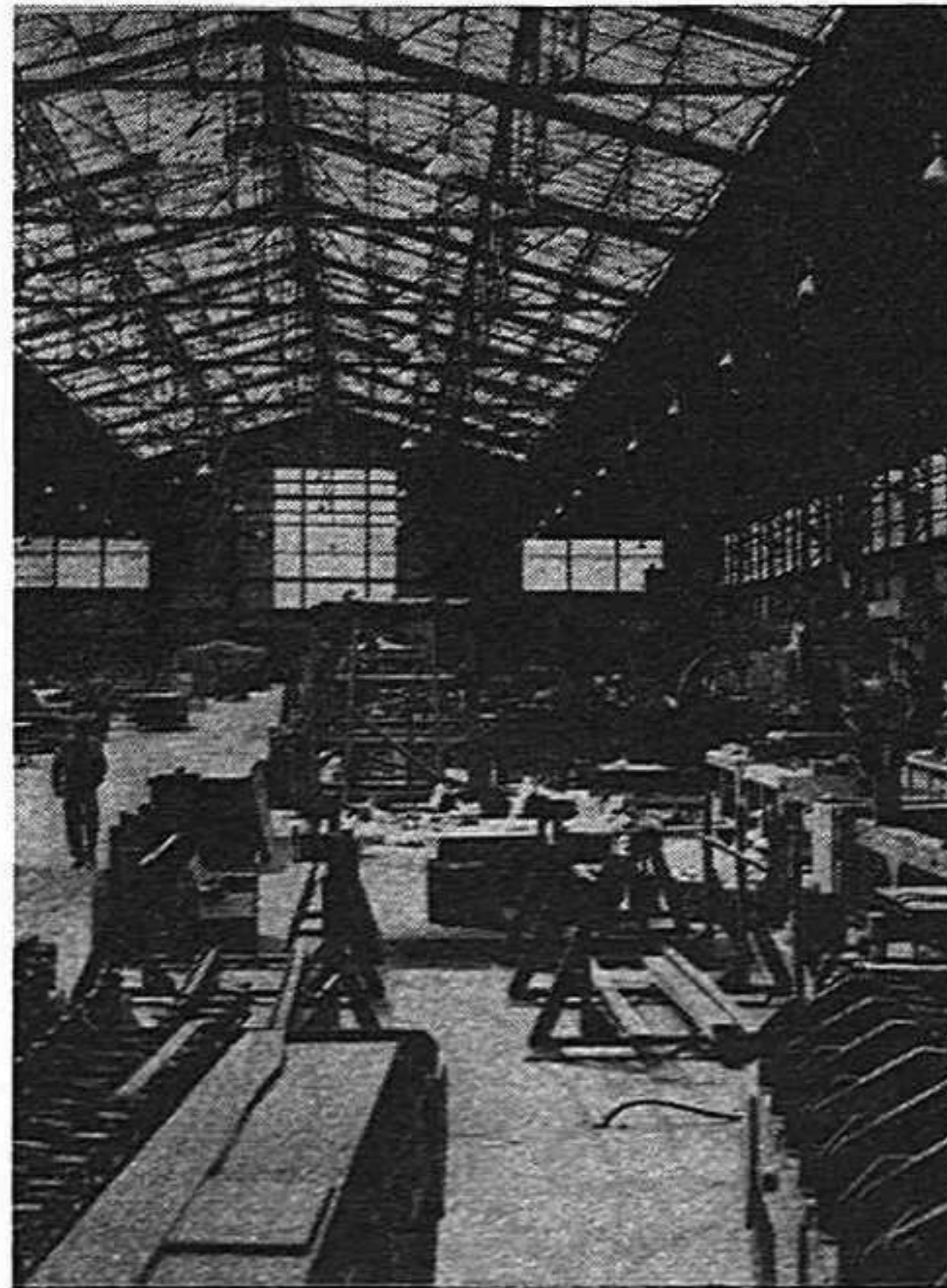
una de las embajadas

Situada en el barrio parisino de «la Goutte d'Or», en Barbés, la película se presenta como un carnet de notas sobre una serie de personajes, cuyos itinerarios se entrelazan y se determinan por el ambiente racista. El psicologismo y la tentación humanista han sido descartados.