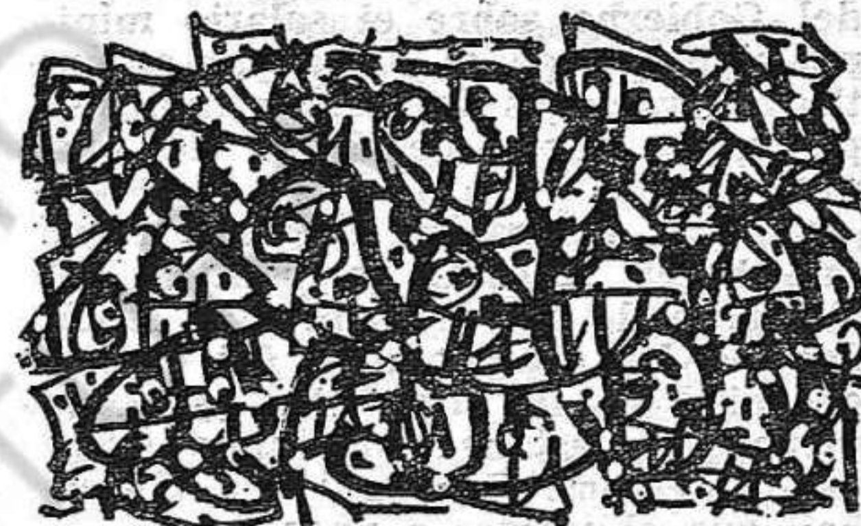
Grabado de A. SAURA: «MASAS»

La conflictividad del sector de la enseñanza es demasiado aguda como para que determinadas promesas o parciales concesiones —que tienen como límite el carácter fascista del gobierno— sean suficientes para realizar la creciente toma de conciencia de necesarios cambios democráticos. También depende de que el M.E. tome la iniciativa con su política de convergencia democrática, aislando al Ministerio y planteando las soluciones reales... Esto significa iniciar una tarea de construcción de un M.E. organizado, estructurado, coordinado a nivel del Estado español, con objetivos comunes, iniciando la ofensiva general contra la política ministerial y por una Universidad de nuevo tipo, con plena autonomía, con libertades democráticas, con gestión democrática.