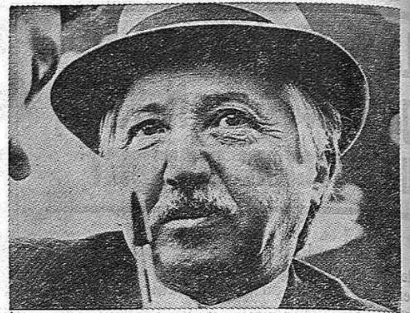
Luis Corvalán sigue en peligro en la isla Dawson ¡Salvémosle!

El Partido Comunista de Chile, fiel a su larga historia de vanguardia revolucionaria, marxista-leninista, permanece firme en su puesto de combate, resistiendo los feroces golpes de la Junta fascista, sometiendo a lúcido análisis la situación real para fijar su línea de marcha. En Santiago ha aparecido recientemente un valioso y extenso documento suscrito por nuestro partido hermano del que extractamos seguidamente el capítulo titulado «Una dirección correcta de la lucha de masas».