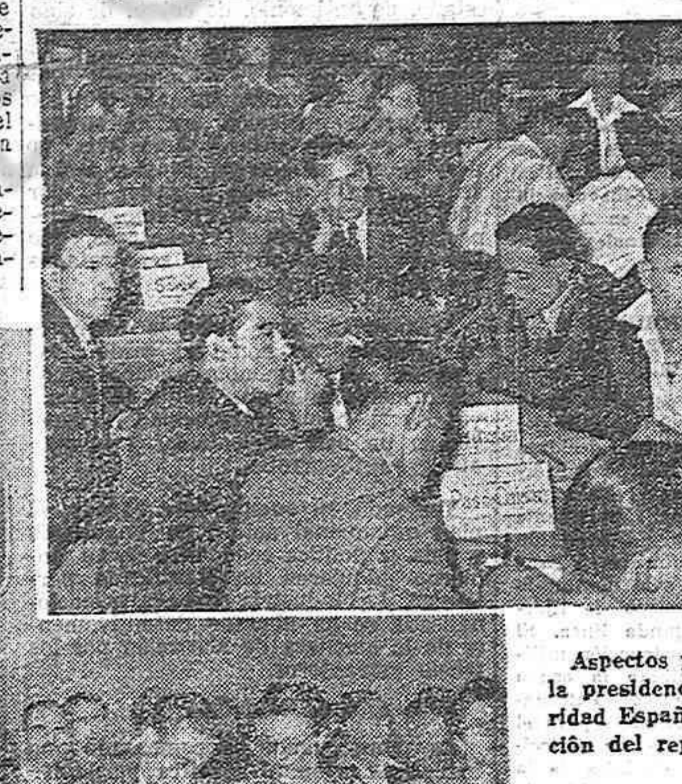
Aspectos parciales de la sala y de la presidencia del Pleno de Solidaridad Española durante la intervención del representante de la C.G.T.