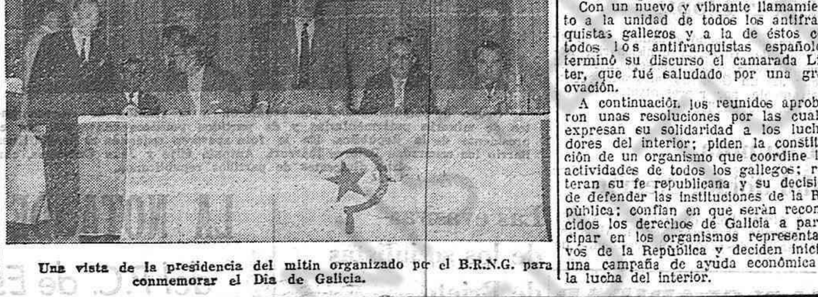
Una vista de la presidencia del mitin organizado por el B.R.N.G. para conmemorar el Día de Galicia.

El discurso de Enrique Lister empezó diciendo que la voz de los republicanos gallegos recuerda en estos momentos difíciles que en toda solución verdaderamente democrática del problema español se deben tener en cuenta los intereses de todos los pueblos hispanos.