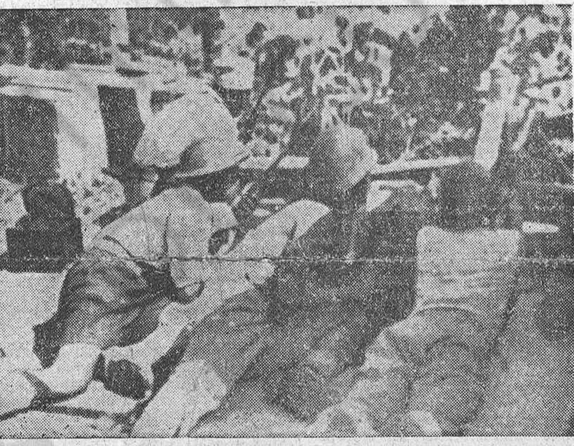
En la pág. 4: NUEVA AGRESION IMPERIALISTA EN INDONESIA Soldados del Ejército republicano indonés en posición.

Los importantes documentos de nuestro Partido han expuesto claramente ante el pueblo español y ante la opinión pública internacional esa situación: El manifiesto del Comité Central de marzo llamando a la defensa de la soberanía nacional y de la democracia; y el comunicado del Buró Político, de fecha 27 de octubre, denunciando la amenaza contra la paz que suponen los manejos de los imperialistas norteamericanos en España, diciendo que la lucha por la paz, la independencia nacional y la democracia está situada en el primer plano para cada ciudadano español y afirmando solemnemente que el pueblo español no hará jamás la guerra contra la Unión Soviética. Estos dos impor-