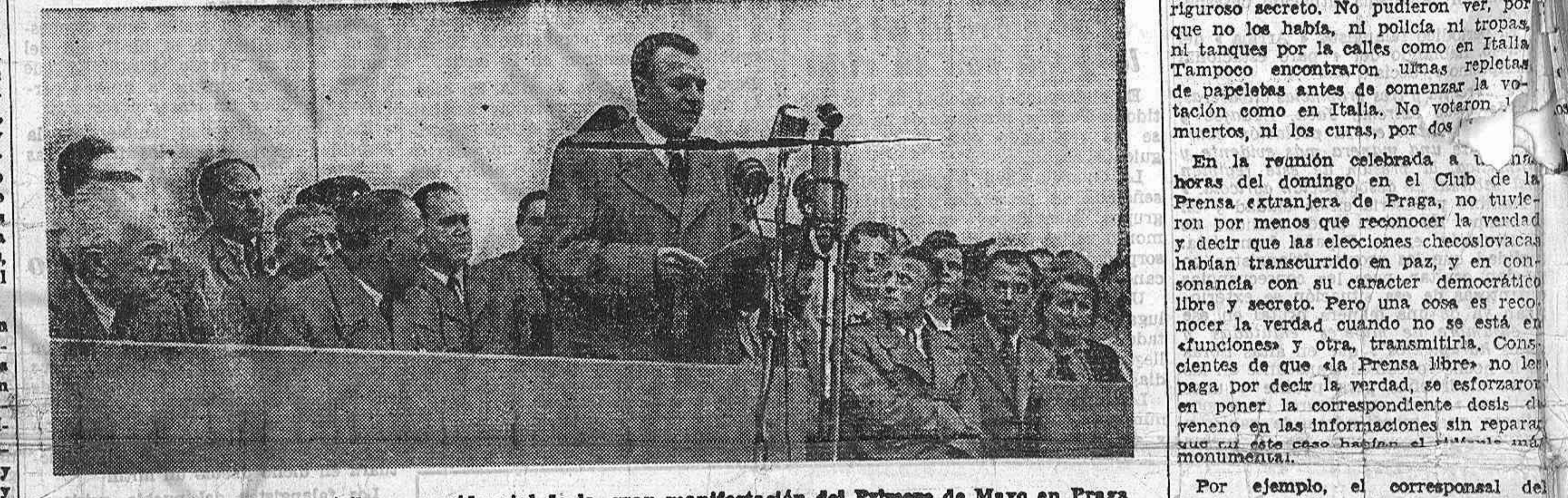
Clement Gottwald, en la tribuna presidencial de la gran manifestación del Primero de Mayo en Praga