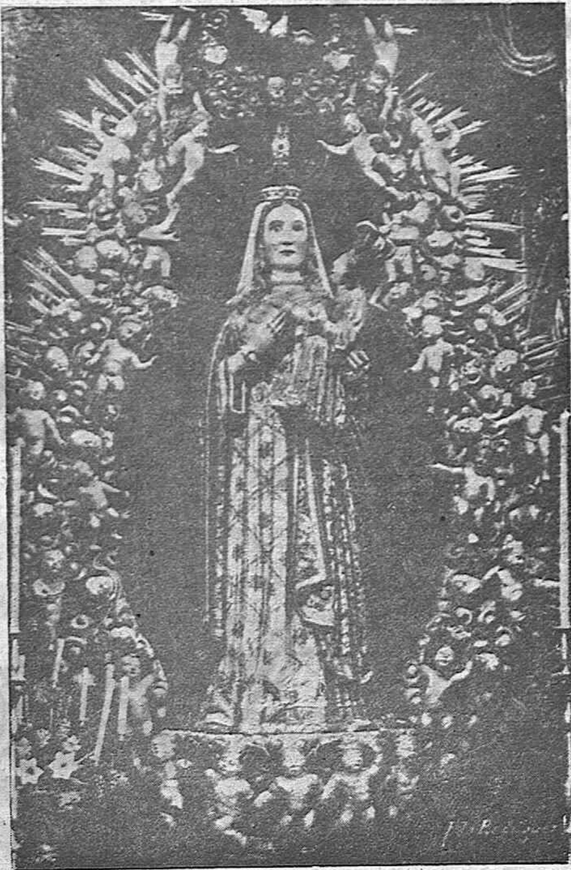
La Virgen de los Ojos Grandes, Patrona de Lugo, que se venera en nuestra Catedral