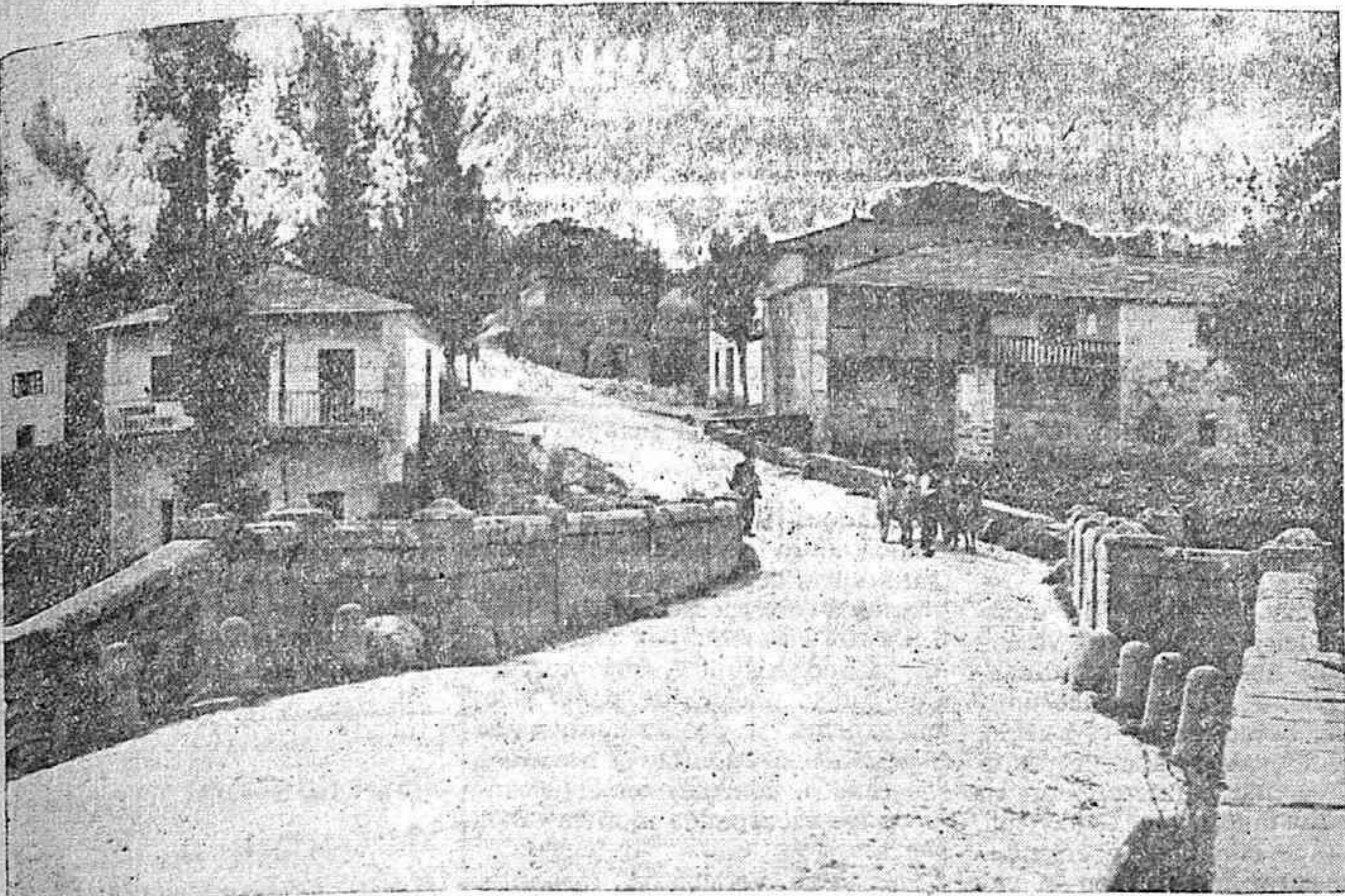
Puente de la Tolda de Castilla