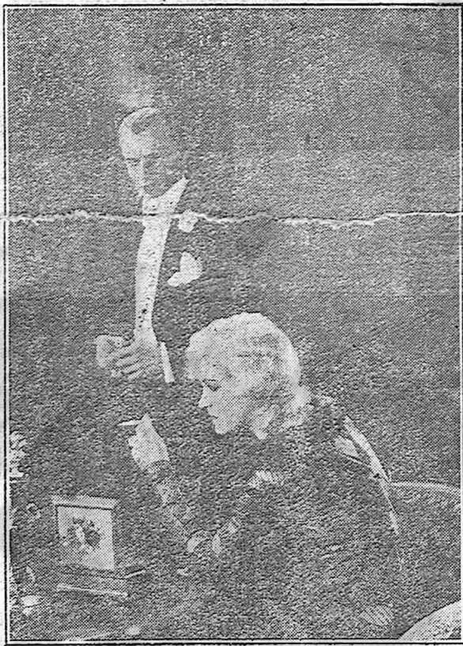
Pola Negri en una escena de «Tres Pecadores»