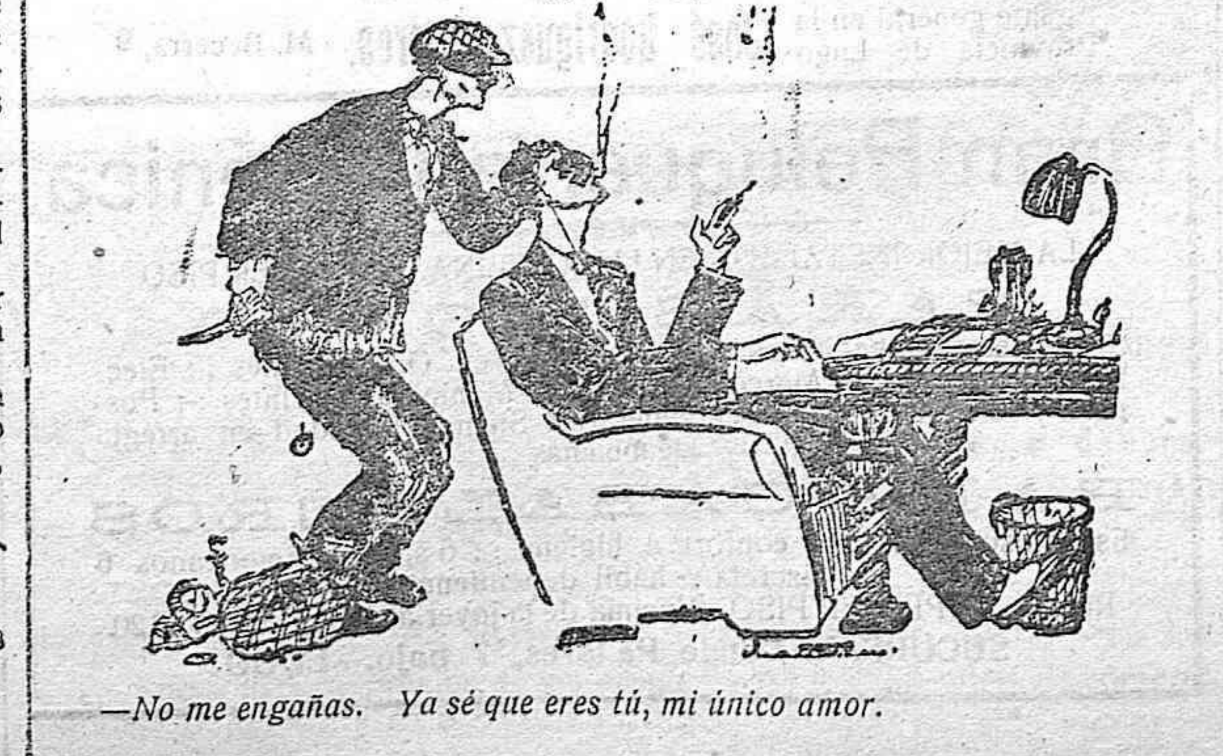
—No me engañas. Ya sé que eres tú, mi único amor.