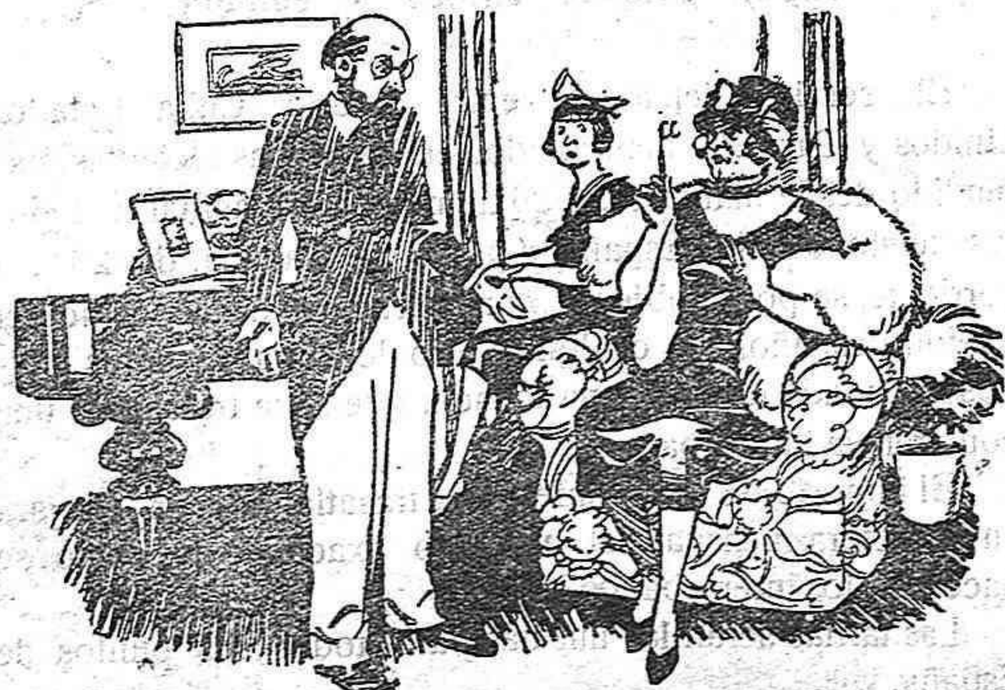
El profesor.—Lamento mucho decirle que su hija no tiene ningún talento musical. La señora.—Pues para eso le pago a usted, para que le dé algún talento.

Art. 529. Cuando el procesado lo fuere por delito a que estuviere señalada pena cuyo límite máximo no exceda de seis años de prisión o de uno de reclusión o pena de confinamiento o de destierro, y no estuviere, por otra parte, comprendido en el número tercero del artículo 492 o en el párrafo primero del artículo 504 de esta Ley, el Juez o el Tribunal que conociere de la causa, decretará si el procesado ha de dar o