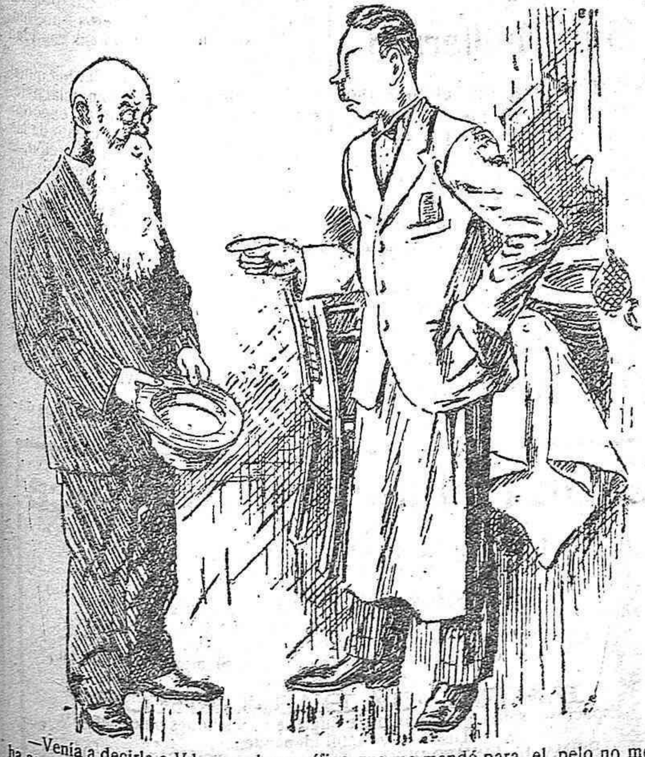
—Venía a decirle a Vd., que el específico que me mandó para el pelo no me ha servido de nada. Vea Vd. la cabeza. —Y quien le ha mandado a Vd. que se lo diera en la barba?

EL PROGRESO es el periódico de mayor circulación, comprobada, en Lugo y su provincia.