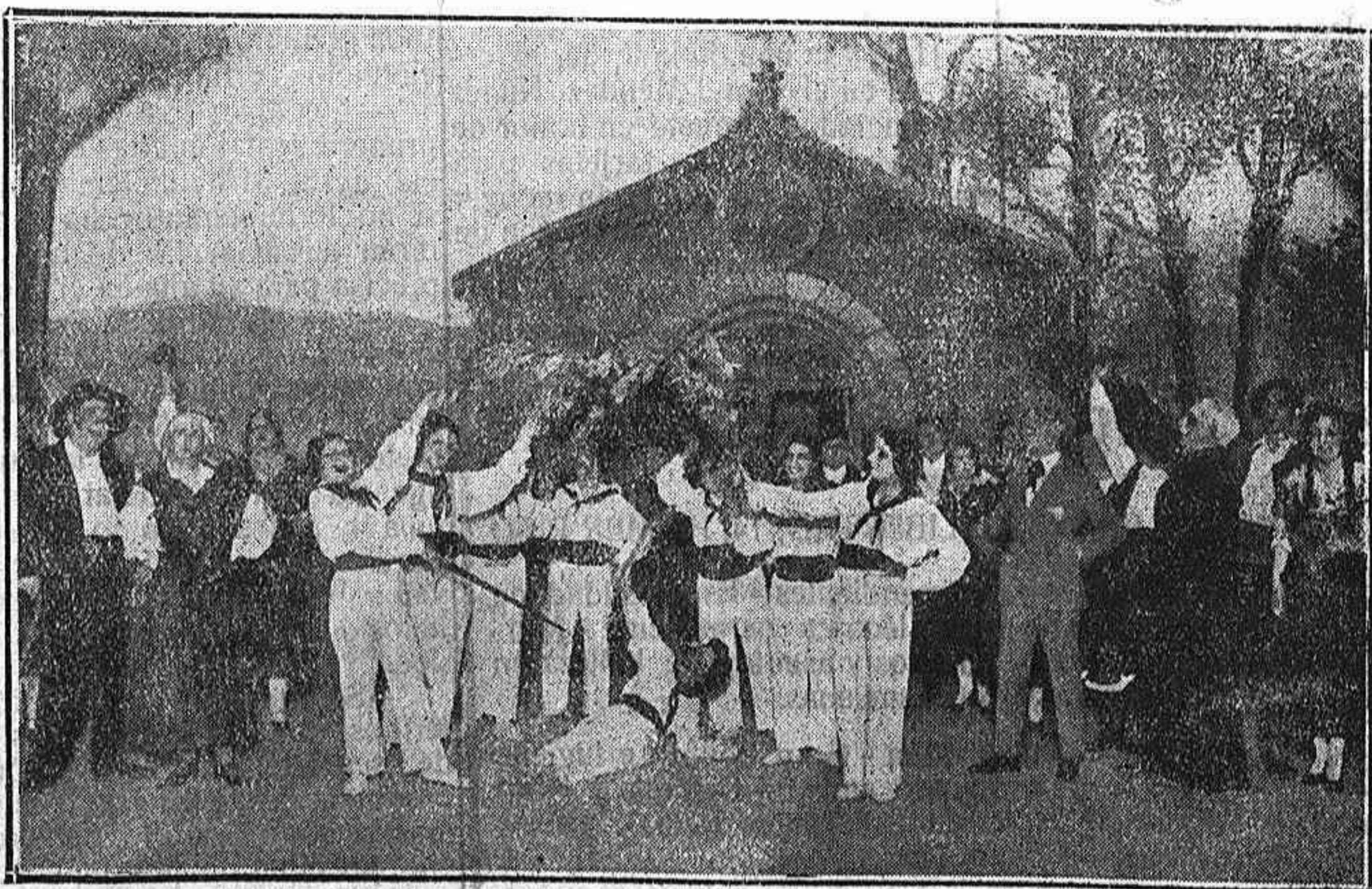
Una de las escenas de «La moza del Ciditaño» que mañana estrena la compañía de Videgain en el Teatro Circulo de las Artes

La nota oficiosa A las nueve menos veinte regresaron los reporteros que se les facilitarían una nota.