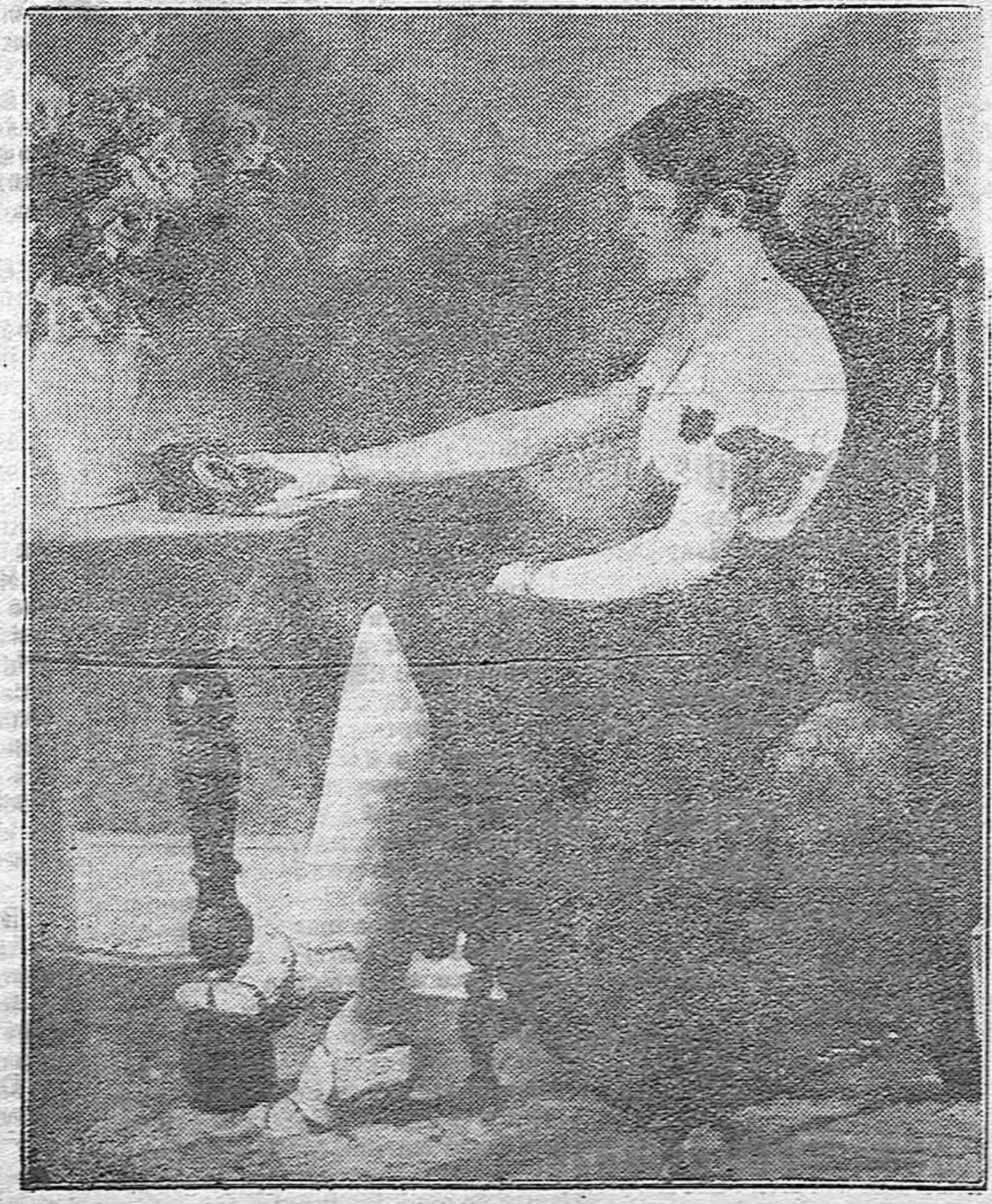
La fotografía representa a una radioyente pidiendo una comunicación para escuchar el programa de su estación favorita; predilección de la que tiene gran culpa el speaker de la emisora, pues en América, los locutores viven asediados por las nostalgias oyentes.

La feliz pareja a la que deseamos muchas prosperidades, salió de viaje por distintas poblaciones de España.